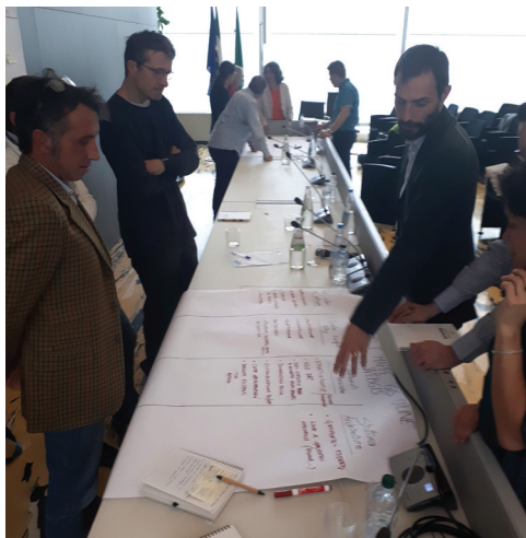
Fig.5: Gruppi di discussione al lavoro.

Per quanto riguarda i sistemi a circuito aperto, l'interazione attiva con la falda pone la necessità di definire delle norme più cautelative. L'elaborazione di procedure semplificate, quindi, dovrebbe essere mirata a impianti di dimensioni medio-piccole, definendo un limite sulla base della portata emunta.