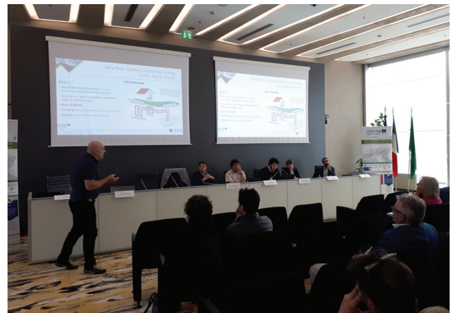
Fig.3: Presentazione introduttiva del Progetto GRETA.