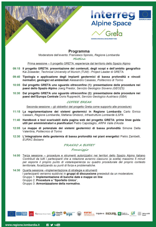
Fig.2: Il programma del workshop.