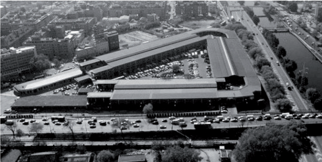
FIG. 1 Madrid, Mercado de Frutas y Verduras: vista aerea Madrid, Mercado de Frutas y Verduras: aerial view