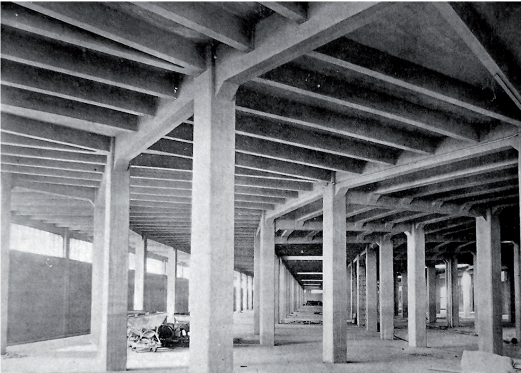
FIG. 2 Madrid, Mercado de Frutas y Verduras: interno del porticato sud al piano superiore, nel 1935 Madrid, Mercado de Frutas y Verduras: interior of the south arcade on the upper floor, in 1935