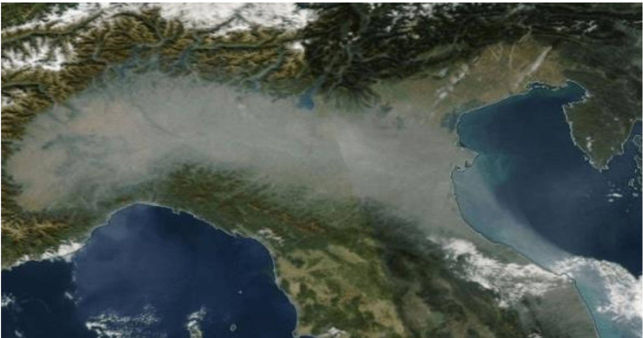
Figura 1. Il bacino del Po visto da satellite in una giornata serena. La bruma visibile indica un elevato contenuto di polveri in prossimità del suolo.

Fra le aree più sensibili agli impatti della mobilità vi è sicuramente la Pianura Padana: circondata da tre lati da montagne (le Alpi a nord e a ovest, gli Appennini a sud) e con solo un, tutto sommato modesto, "sfiato" verso est, per di più affacciato su di un mare interno poco profondo. In sostanza le condizioni fisiche tendono a favorire il ristagno nella bassa atmosfera in prossimità del suolo di polveri e inquinanti diversi. Dal punto di vista globale poi, il mutamento climatico in atto sembra destinare la Pianura Padana, eventi estremi a parte, ad un progressivo impoverimento delle risorse idriche. Già da molti anni i satelliti artificiali ci restituiscono visivamente la situazione, come in Fig.1.