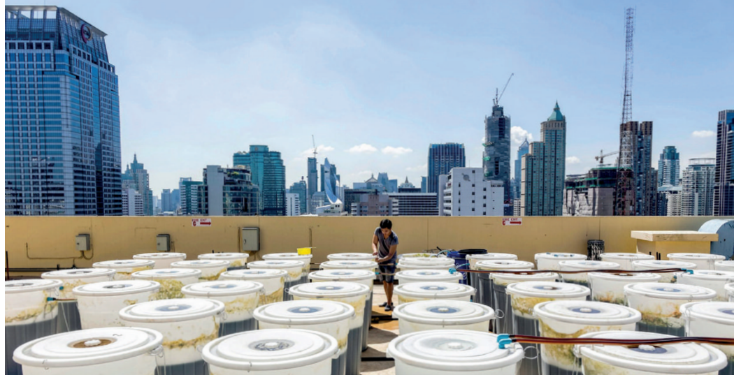
Fig. 16 | Startup EnerGaia grows Spirulina on the rooftop of the hotel Novotel in Siam Square, Bangkok.

to include projects within far more extended contexts, such as city events or multi-purpose areas, as if to emphasize the need to connect them to the surroundings. Apart from some exemplary cases, most do not ponder the possibility of using microalgae as a vector of economic growth and social integration. These are two undoubtedly critical areas of practice and research that deserve to be explored. Finally, the communication and promotion of the values of these projects are particularly compelling but poorly investigated. The case studies analyzed have significant limitations but at the same time present new possibilities. To design for the benefit of the community, dealing with the problems of cities with resilient thinking, projects like these should operate with a larger range of action, and in the long term, with the intent of favouring their scalability. This approach would promote new visions not only linked to the creation of a product but also the economic and social infrastructures in their entirety (Peruccio et alii, 2018).