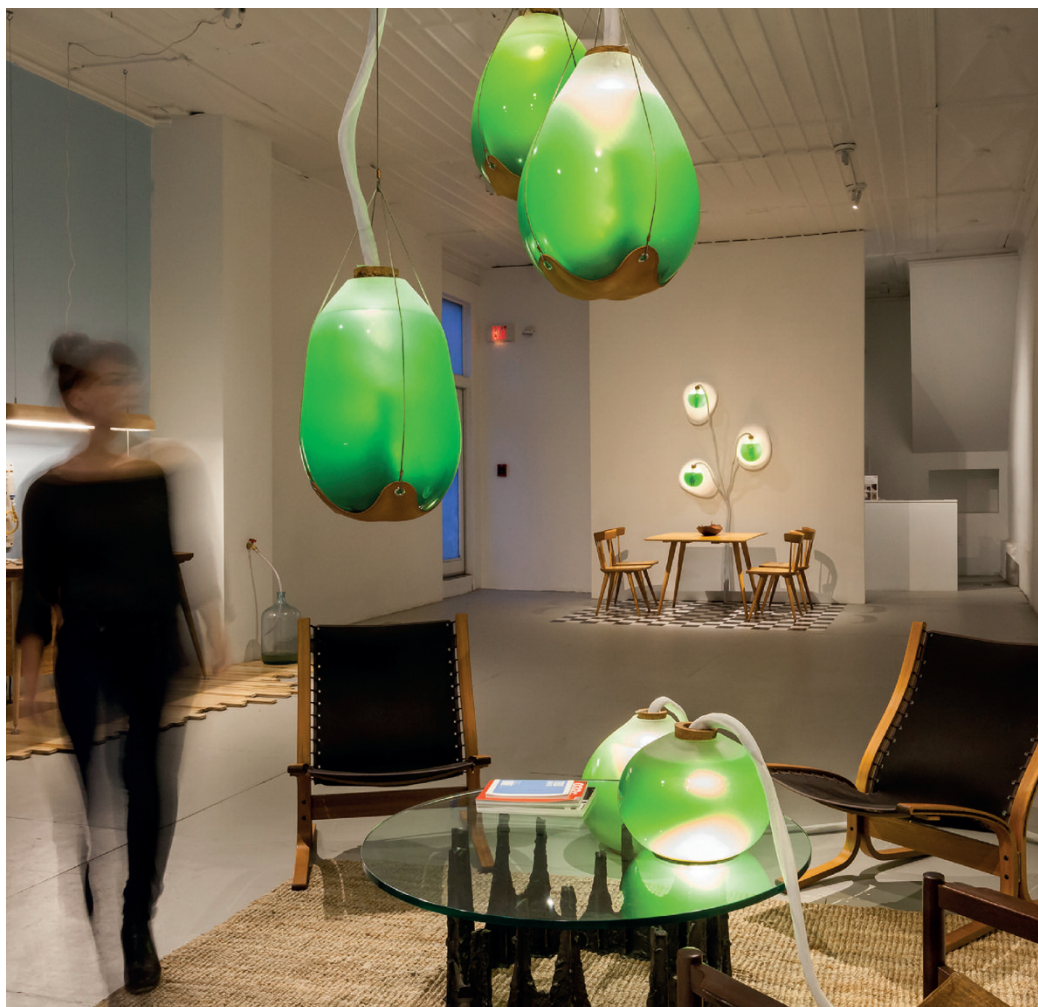
Fig. 6 | Living Things is an installation by J. Douenias and E. Frier at the Mattress Factory Museum in Pittsburgh, Pennsylvania, 2015.

Sulla base delle necessità progettuali è d'uopo identificare le specie più indicate per il caso particolare, prevenendo che se usate a scopo alimentare devono essere coltivate in acque incontaminate. Il designer dovrebbe distogliere l'attenzione dalla sola componente materiale del progetto, focalizzandosi sulla definizione di servizi annessi, esperienze e sugli aspetti educativi. Data la scarsa conoscenza del tema a un pubblico di non esperti, è bene fornire nozioni di carattere generale che ne per-