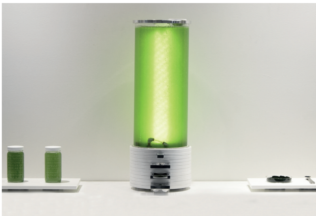
Fig. 4 | Timelapse Ink by Living Ink Technologies is a sustainable bio-ink obtained from algae that can also be used for digital printing (credit: Living Ink Technologies, 2015).