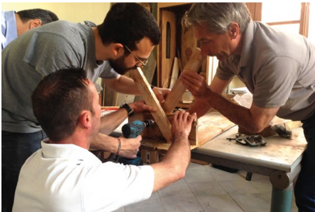
Figura 9. Torino, 2014-2019. Approccio alle capacità: i workshop sono l'occasione di un incontro di biografie in un rapporto di reciprocità.