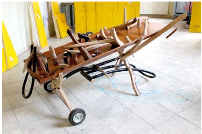
Figura 10. Torino, 2014-2019. Approccio alle capacità: flipper non tecnologico progettato e auto-costruito dai partecipanti al progetto per i bambini di una comunità di famiglie in emergenza abitativa.

l'acquisizione di nuove risorse di tipo pratico e relazionale avvengono nel corso di processi creativi e progettuali collettivi ed esperienze di autoproduzione e autocostruzione. A Torino, dal 2014, due volte alla settimana cittadini, studenti di vario grado, giovani in formazione professionale, associazioni di volontariato sono coinvolti, insieme alle persone senza dimora, in workshop di design 24 . In questa dimensione collaborativa, si producono scambi profondi che suggeriscono modelli di coesione sociale e sollecitano esercizi di cittadinanza attiva e responsabile 25 . I prodotti di