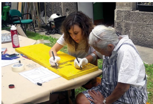
Figure 4-7. Milano, 2014-2015. Accoglienza per migranti e persone senza dimora: co-progettazione e co-costruzione degli arredi e degli interventi di wall painting con operatori e utenti; in collaborazione con Fondazione Progetto Arca e Università di Torino.

educativi e strumenti di relazione, per agevolare i rapporti di coabitazione e l'accesso ai servizi. Stazioni dove caricare i cellulari al sicuro dai furti, sistemi collettivi di seduta, interventi di wall painting , sistemi letto, grafiche di orientamento: le soluzioni co-progettate e spesso co-costruite permettono di reinterpretare e attrezzare i luoghi dell'accoglienza rendendoli luoghi sicuri e abilitanti 23 .