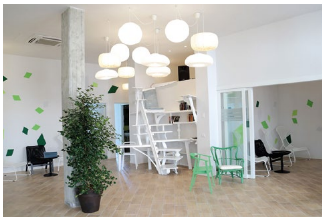
Figure 2, 3. Milano, 2014-2015. Accoglienza per persone senza dimora con problemi di dipendenze: co-progettazione dei luoghi e degli arredi della zona notte con operatori e utenti; in collaborazione con Fondazione Progetto Arca e Università di Torino.