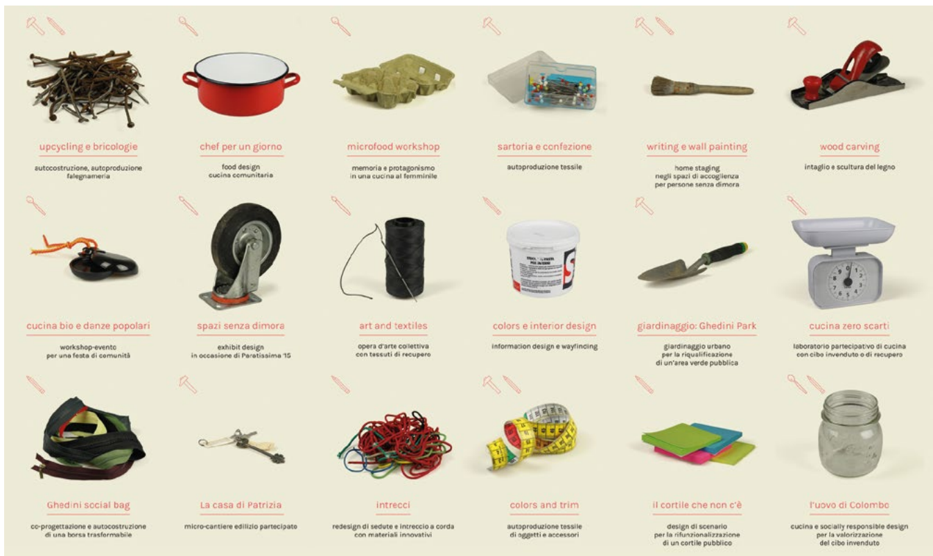
Figura 8. Torino, 2014-2019. Approccio alle capacità: alcuni temi dei workshop attraverso cui si svolge il laboratorio di inclusione sociale mediante processi di co-design.