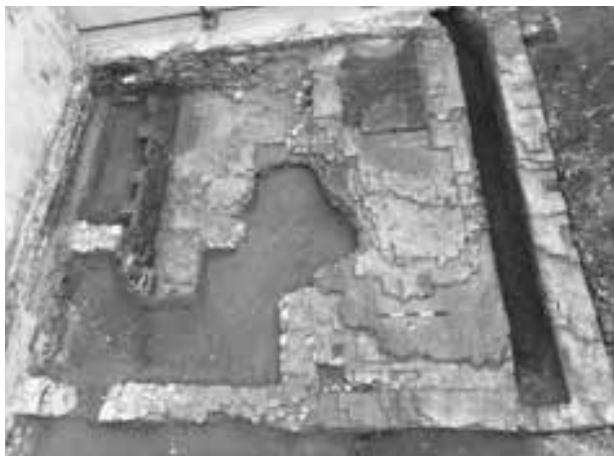
Fig. 104. Torino, via Maria Vittoria 7c. Struttura ottocentesca riferibile agli impianti del palazzo.

rie (us 31). Nei due piani, i laterizi sono disposti di piatto in quello inferiore, mentre di coltello in quello superiore (modulo 23x5,5x11,5; 22x10,5x5,5 cm).