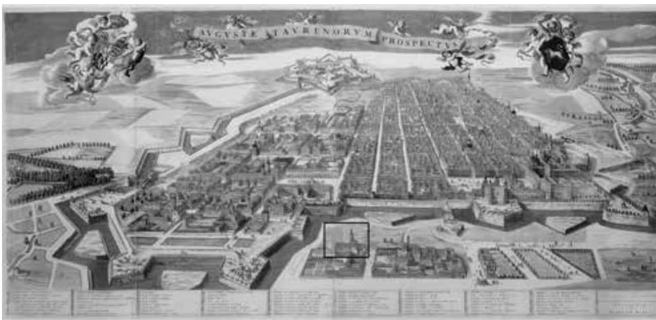
Fig. 102. Torino, via Maria Vittoria 7c. Individuazione dell'area di intervento sul Theatrum Sabaudiae (da Theatrum Sabaudiae I, 9).

La prima fase di occupazione successiva a quella romana attestata nel corso dello scavo è, tuttavia, rappresentata dalla predisposizione di un sistema di canalette e pozzi perdenti sette-ottocenteschi.