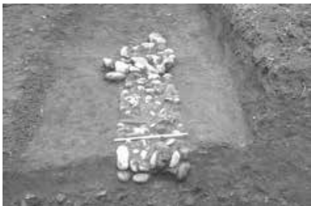
Fig. 101. Torino, via Maria Vittoria 7c. Le strutture di età romana uoss 7 e 8.

piani di calpestio interni. Il piede della fondazione è interamente costituito da ciottoli disposti a secco, mentre nei corsi superiori sono impiegati ciottoli di dimensioni sensibilmente inferiori, frammenti laterizi e tegulae legati da malta biancastra, sabbiosa ma a tratti piuttosto tenace, con grossi inclusi. A est dell'us 8 è stato individuato un livello argilloso (us 5) la cui superficie, caratterizzata dalla presenza di frustoli carboniosi e di numerosi minuti frammenti ceramici in giacitura orizzontale, suggerisce possa trattarsi di un piano di calpestio, probabilmente quello di cantiere, in fase con le strutture rinvenute. Una buca di forma ellissoidale (us 29), collocata all'esterno dell'ambiente definito dalle uoss 7-8, sembra interpretabile come discarica domestica per il riempimento, conte-