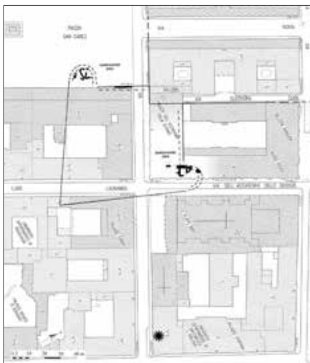
Fig. 100. Torino, via Maria Vittoria 7c. L'area di intervento rispetto ai resti del bastione cinquecentesco (elab. S. Salines).

Sui terreni argillosi naturali leggermente digradanti verso sud-est, a una quota compresa fra 233,45 e 233,63 m s.l.m., sono emersi gli ultimi filari di fondazione di due strutture murarie di età romana, ortogonali fra loro (uuss 7 e 8) (fig. 101). Il punto di raccordo tra le due risulta asportato dal passaggio di un condotto moderno, tuttavia appare evidente, per analogia delle quote e delle caratteristiche costruttive, che costituissero i limiti di un ambiente sviluppato in direzione nord, di cui non si sono rilevati