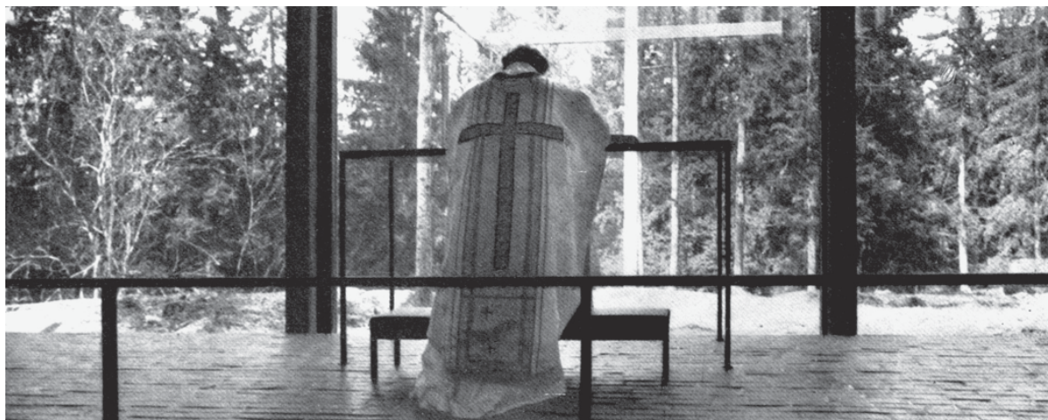
Arquitectura protestante y Modernidad. Hitos, transferencias, perspectivas Santiago de Chile, 23-27 de agosto de 2017 número 5