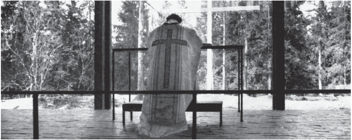
Arquitectura protestante y Modernidad. Hitos, transferencias, perspectivas Santiago de Chile, 23-27 de agosto de 2017 número 5