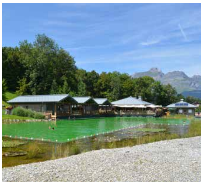
L'insieme dei volumi che prospettano l'area di balneazione, nei quali sono ospitati il centro benessere, il ristorante e il bar. Il progetto architettonico è stato curato dall'Atelier Axe Architectes.