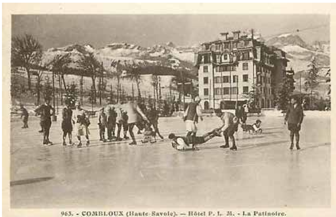
963. - COMBLOUX (Haute-Savoie). — Hôtel P. L. M. - La Patinoire.

Una cartolina degli anni cinquanta, raffigurante la patinoire pubblica a lato del Grand Hotel du Mont Blanc (Archivio Comune di Combloux).