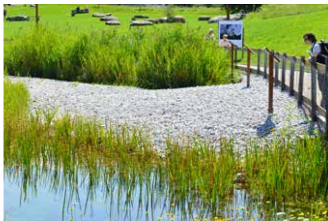
Il percorso pedonale è attrezzato con pannelli esplicativi contenenti informazioni a riguardo delle specie vegetali utilizzate nell'impianto.