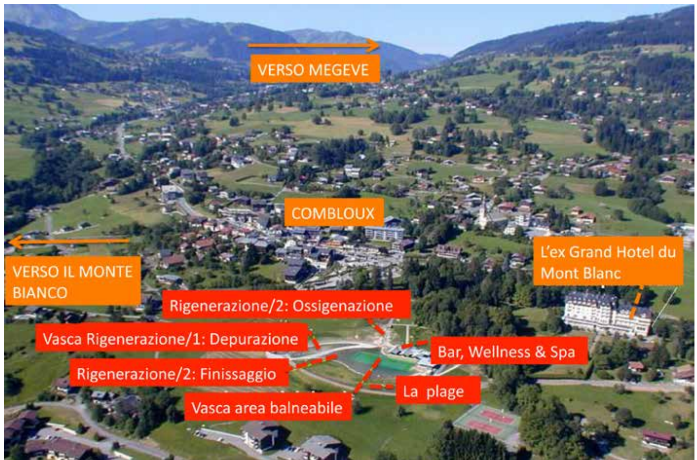
Vista d'insieme sul Plan Perret nel suo contesto territoriale.

ma di piani rimodellati e vegetati ex-novo sulle terrazze naturali (aree tematiche per le bocce e il gioco dei bambini) – che si aprono sulla scalinata centrale: percorrendola in discesa, il punto di arrivo è un belvedere che si affaccia sul Plan Perret, ora ribattezzato in Plan d'Eau Biotope proprio perché su quella terrazza naturale è stata costruita la biopiscina.