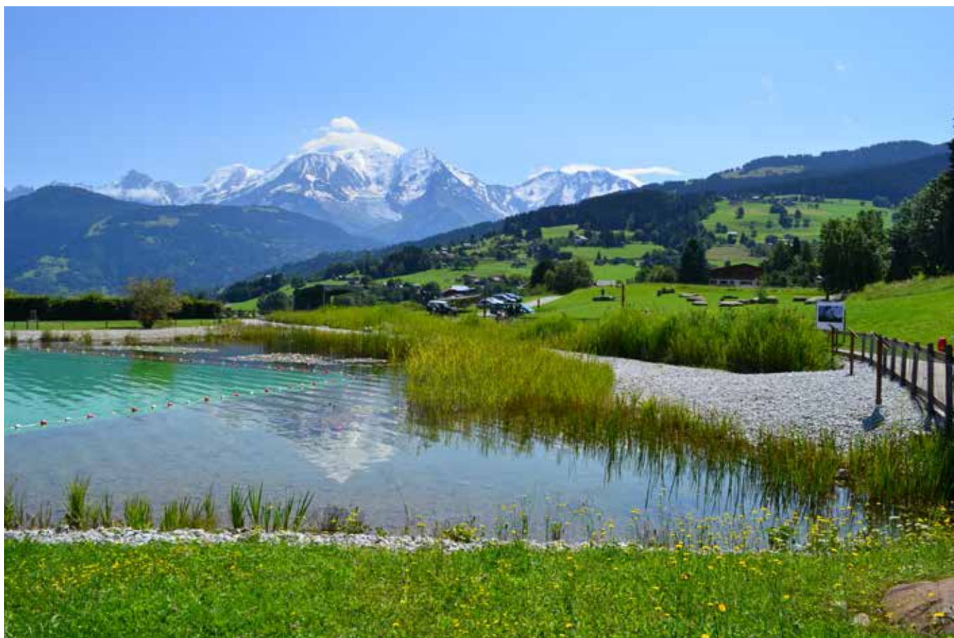
Nuoto en plen air con vista: la catena del Monta Bianco fa da sfondo alla sequenza di bacini.