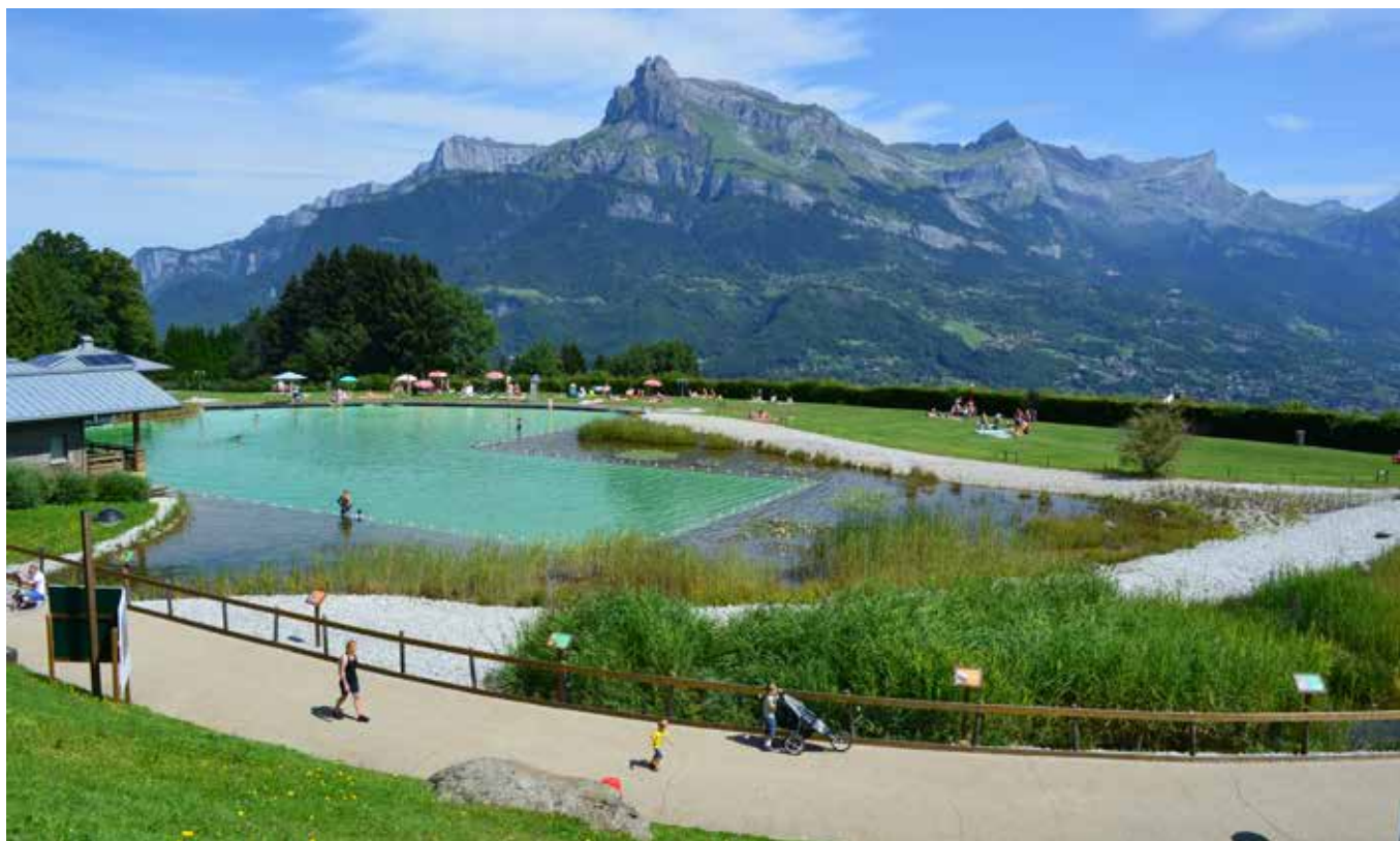
Il belvedere aperto sul panorama circostante, affacciato direttamente sulla biopiscina (fotografia di A. Mazzotta, 2014).