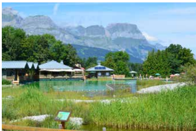
Vista dell'impianto dall'area di depurazione verso quella di balneazione. Al centro, la zona di finissaggio. (fotografia di A. Mazzotta, 2014 ).