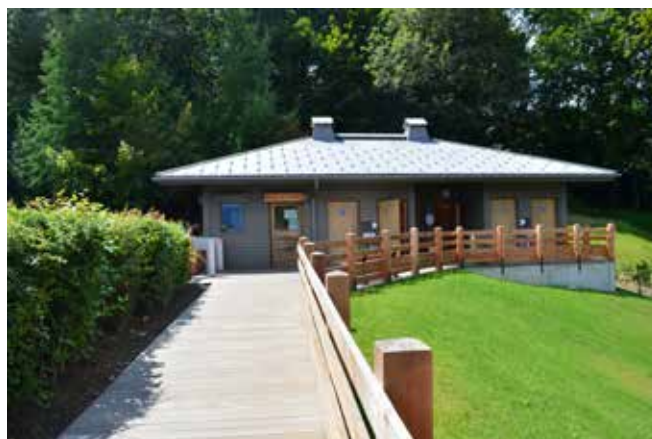
In alto. Edificio per la recettività estiva.