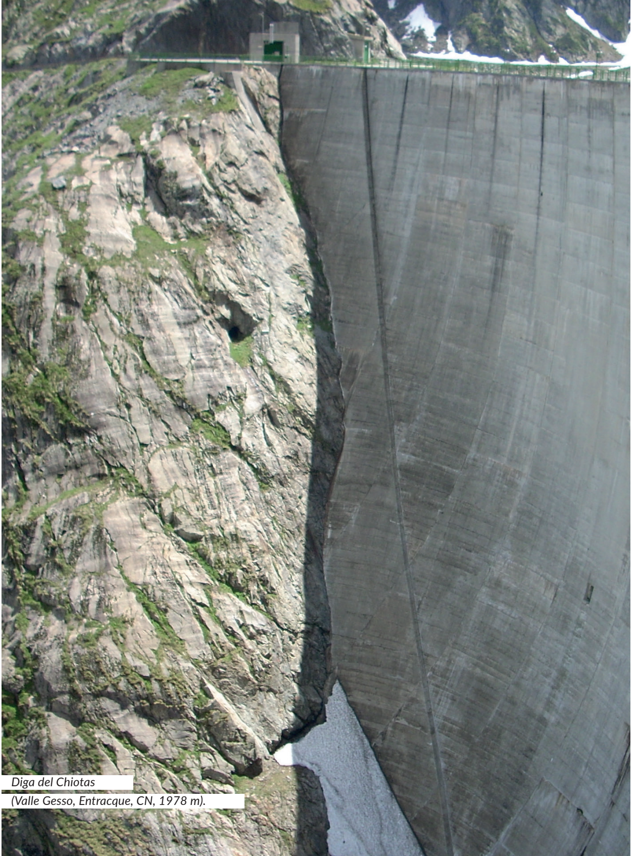
Diga del Chiotas