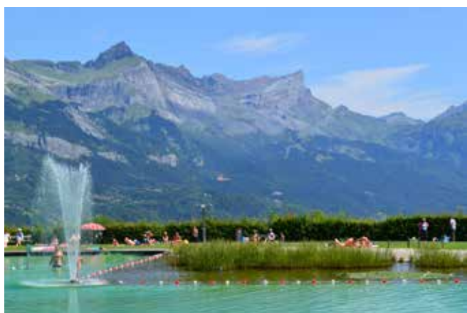
La filtrazione dell'acqua a mezzo di ossigenazione è occasione per segni di spettacolarizzazione: lo zampillo d'acqua per ostacolare l'eutrofizzazione superficiale e la cascata.