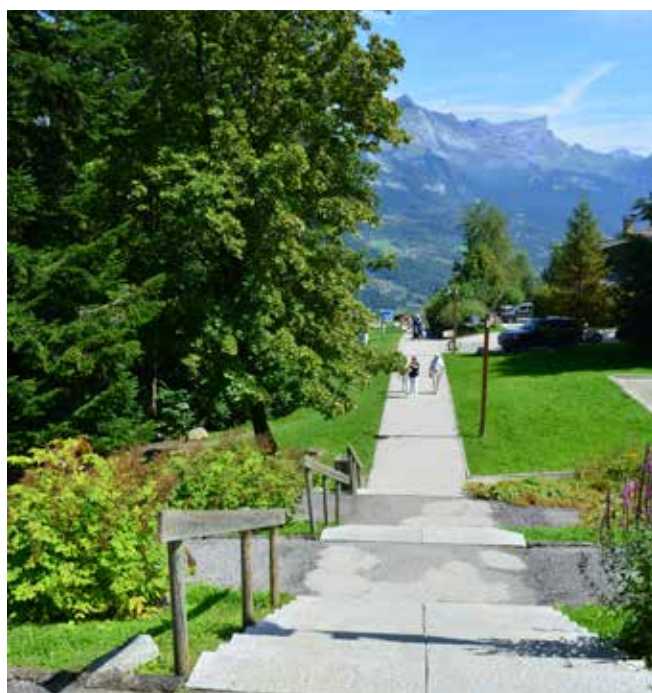
L’asse pedonale della coulée verte che collega le zone attrezzate per le attività di svago en plein air (fotografia di A. Mazzotta, 2014).

Acquistati i terreni, il soggetto pubblico ha promosso un intervento che allude allo storico significato dell’area, attualizzandone il carattere: una coulée verte pedonale, che parte dal centro del paese e si articola in “stanze a cielo aperto” lungo il pendio – confermando alcuni declivi (parco d’avventura e aree pic-nic nell’area boscata originaria), e riconfigurandone altri in for-