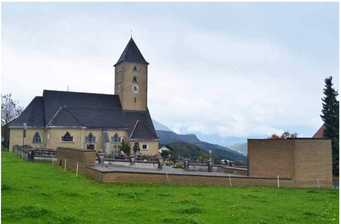
L’ampliamento del cimitero di Batschuns: rimandi cromatici.

Alcuni interventi ex-post in altri cimiteri denunciano attenzioni “micro”, ma interpretate progettualmente sempre con attenzione alla