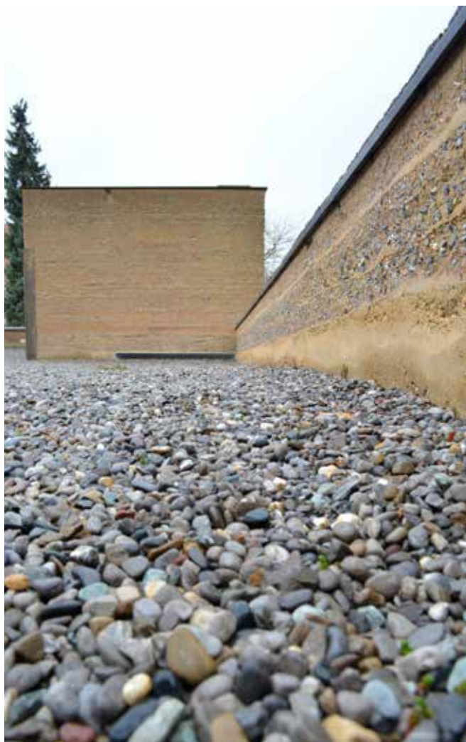
L'ampliamento del cimitero di Batschuns: texture orizzontali e verticali.

percezione alla scala del paesaggio: per citare un esempio, nel cimitero del villaggio di Krumbach, lungo uno dei rami laterali del corridoio vallivo che attraversa il Bregenzerwald, l'esigenza di ricostruire gli scalini di percorrenza e il venire incontro a esigenze funzionali legate alle sepolture stesse (come quello dei punti di accesso pubblici all'acqua per l'innaffiatura dei fiori) si traducono nella realizzazione di alzate in acciaio Corten a bordare gradini e gradoni e di un setto con inserti in acciaio e alluminio nel muro di delimitazione, ovvero rubinetti di adduzione e griglie di scolo sotto i punti stessi di erogazione dell'acqua.