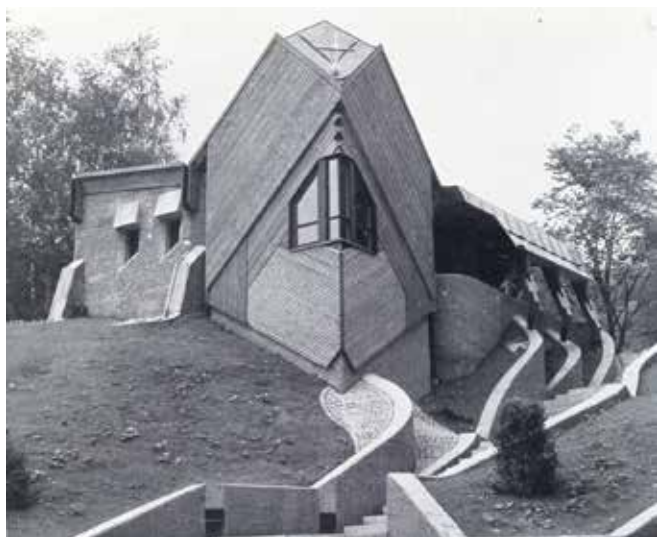
Cappella del cimitero di Schwarzach: segno di paesaggio costruito e pavimentazioni drenanti negli spazi aperti di lotti (“L'architettura. Cronache e storia” cit.).

Nei cimiteri dei borghi di montagna l'accezione di hortus conclusus assume il significato di spazio vivibile – anche in relazione alla sua intimità – per la meditazione, il cui confine è valicato non solo da chi nel recinto entra per ossequiare i propri defunti, ma anche da parte del visitatore occasionale: spesso appartati in posizione dominante sul contesto e privilegiata dal punto di vista ambientale – perché, in adiacenza a chiese e cappelle, prossima a boschi o prati – i luoghi di sepoltura sulle alpi invitano a varcare i cancelli che li delimitano (se esistono) e a godere di uno spazio di riflessione nell'am-