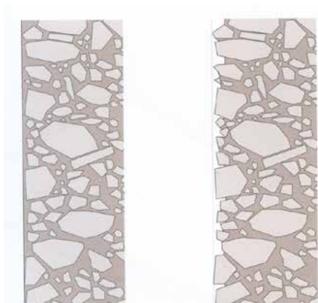
L'ampliamento del cimitero di Batschuns: texture che si modificano nel tempo (Kapfinger O., Sauer M., Martin Rauch cit.).

Gli spazi che ne derivano appaiono ben delimitati dai nuovi muretti, ma nello stesso tempo sono molto permeabili rispetto alle vicine per-