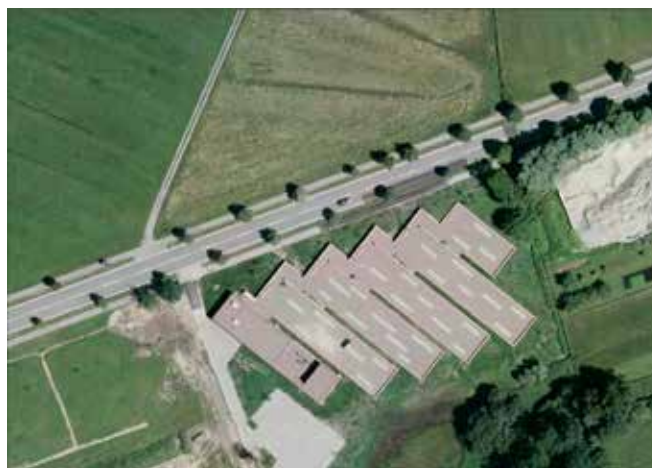
Cimitero di Altach: infrastrutturazione del paesaggio (Archive Architect e Bernardo Bader + Azra Aksamija).

Lo spazio dei cimiteri è uno dei temi attraverso i quali il tema è declinato anche nei suoi risvolti in termini di visibilità del progresso sociale.