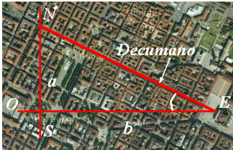
Figura 2: Il decumano è l'ipotenusa del triangolo. Misurando i lati a e b , troviamo l'angolo. Dalla figura si ha che esso è di 25.8 gradi.