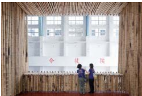
• Stan Allen Architect | Taichung Infobox | 2011