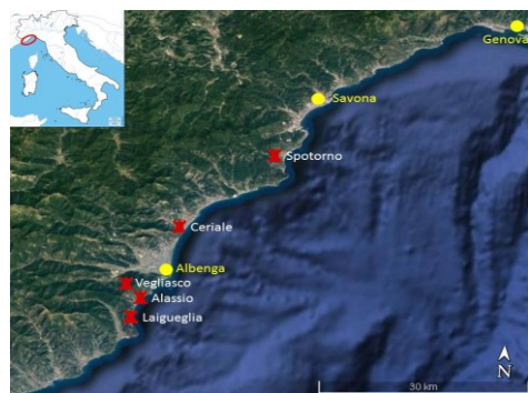
Fig. 5- Torri studiate nella Riviera di Ponente (mappa modificata da Google Earth, 2018)

Sono state prese in esame le torri di Spotorno, Ceriale, Alassio, Vegliasco e Laigueglia (Fig. 5).