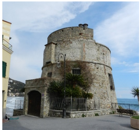
Fig. 4- La torre di Alassio (Mattone, 2018)

L'accesso avveniva attraverso una porta posta in posizione sopraelevata e sormontata da caditoie. Il collegamento verticale tra i differenti piani era assicurato dalla presenza di scale interne che potevano essere sia in legno, sia in muratura ricavate nello spessore delle pareti esterne. Per quanto riguarda in particolare le torri a pianta circolare localizzate in prossimità del mare (Fig. 4), queste presentano «proporzioni piuttosto massicce, con cordonatura di coronamento della scarpa situata