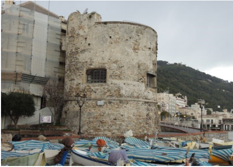
Fig. 7- Torre di Laigueglia (Fratini, 2018)