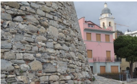
Fig. 8- Torre di Alassio: corsi suborizzontali (Fratini, 2018)

Gli elementi lapidei utilizzati per la costruzione delle torri provengono dagli immediati dintorni dei siti costruttivi e quindi rispecchiano la geologia locale. Quando possibile sono stati utilizzati grossi ciottoli torrentizi ma più spesso rocce spaccate che, nel caso di utilizzo di rocce sedimentarie in strati di spessore decimetrico, ha permesso di ottenere blocchi regolari disposti in corsi sub orizzontali (Fig. 8).