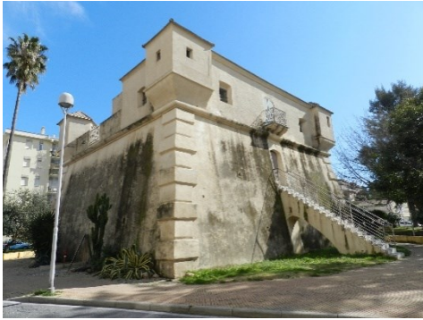
Fig. 1- Il bastione di Albenga (Mattone, 2018)

A partire da Ceriale verso Imperia si riscontrano invece numerose torri a pianta circolare e sezione troncoconica, che presentano «una forma tipologica di concezione più consona alle esigenze costruttive imposte dalle nuove tecniche belliche» 5 (Fig. 2).