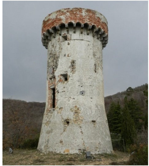
Fig. 3- Resti di intonaco sui paramenti esterni della torre di Vegliasco (Mattone, 2018)

Pur differenziandosi nelle forme, le costruzioni di difesa costiera liguri sono accomunate da ricorrenti caratteristiche costruttive. In entrambi i casi le murature sono di notevole spessore ed eseguite a sacco, utilizzando materiale locale, di facile approvvigionamento. I paramenti murari sono misti in pietra e laterizio con elementi lapidei per lo più a spacco e non lavorati. Le superfici «erano intonacate con malta di calce bianca» 5 che ne garantiva l'uniformità e la protezione dagli agenti atmosferici (Fig. 3) (De Maestri, 1971).