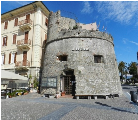
Fig. 2- La torre di Ceriale (Mattone, 2018)

A partire da Ceriale verso Imperia si riscontrano invece numerose torri a pianta circolare e sezione troncoconica, che presentano «una forma tipologica di concezione più consona alle esigenze costruttive imposte dalle nuove tecniche belliche» 5 (Fig. 2).