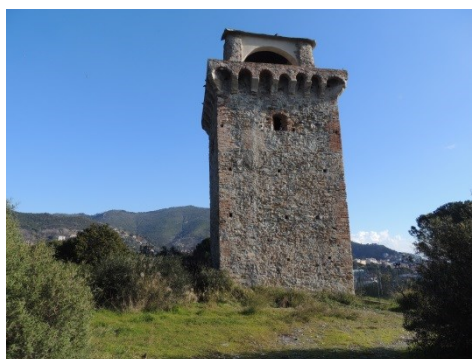
Fig. 6- La torre di Spotorno (Fratini, 2018)

L'ingresso originario sopraelevato è stato tamponato ed è stata aperta una porta di accesso a piano terra. La muratura è di tipo misto (pietra e laterizi) con apparecchiatura senza corsi costituita da blocchi sia di forma irregolare che da grossi ciottoli fluviali.