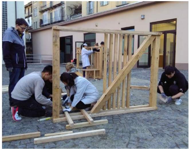
Assemblaggio degli arredi al LaSTin.

d'uso. Il luogo ideale era la nostra stessa sede accademica: si è quindi proposto il disegno di un elemento di arredo esterno da collocare nella corte meridionale del Castello del Valentino, all'innesto tra la il corpo principale e la tardo-ottocentesca manica Chevalley. Ogni prima idea riguardo al possibile tema è stata preceduta da lezioni e visite introduttive alla residenza, che ponessero lo studente di fronte alla ricca complessità del contesto storico e, in parallelo, alle esigenze di una fruizione giornaliera da parte di un folto gruppo di utenti, interessati certo al grandioso edificio, ma non nella condizione di visitarlo come un museo. È apparsa allora evidente la carenza di luoghi in cui sostare, in cui scambiarsi appunti, discutere di una lezione, o semplicemente godere per qualche minuto di un raggio di sole guardando all'architettura storica attorno a sé. Un punto di sosta, incontro e piccola esposizione, quindi, con varietà di sedute e appoggi, facilmente realizzabile dagli stessi studenti, con il vincolo essenziale dell'utilizzo di una "scatola di costruzioni" data, corrispondente al materiale a disposizione: travi e travetti a sezione quadrata (5x5 e 10x10 cm) e tavole di castagno locale, oltre alla ferramenta per le connessioni e del rispetto totale della preesistenza monumentale.