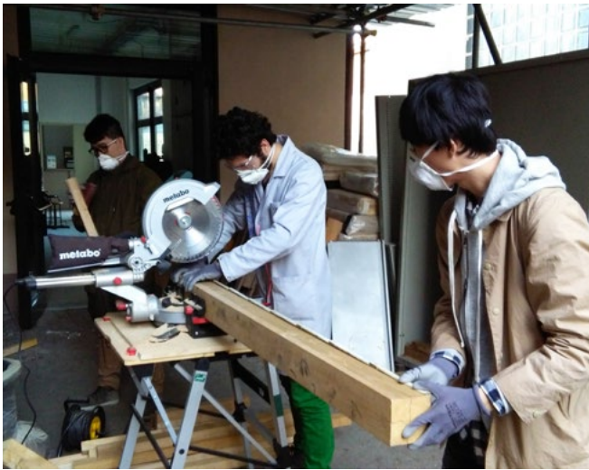
Taglio del legno al LaSTin.