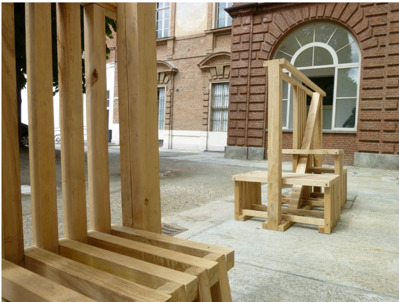
Gli arredi collocati al Castello del Valentino lungo la manica Chevalley.

Le fasi finali sono state un vero lavoro collettivo, in cui ogni scelta e decisione è stata valutata con l'apporto di tutti i presenti. Il gruppo si è cementato con il procedere della costruzione e appassionato alla realizzazione, anche se il progetto iniziale non era stato il proprio.