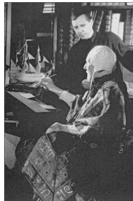
L'ultima tempesta (Prospero's books) di Peter Greenaway, Olanda/Francia/Italia, 1991