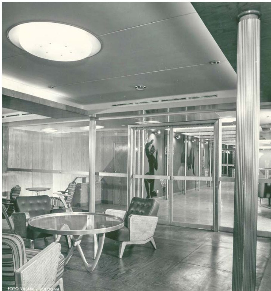
Gustavo Pulitzer Finali, Motonave Campania Felix, 1952, sala soggiorno bar Ponte passeggiata di I° e II° classe

ASSOCIAZIONE NAZIONALE ARCHIVI ARCHITETTURA CONTEMPORANEA • BOLLETTINO N° 16