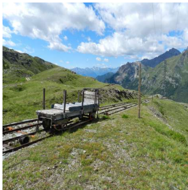
Figura 4. Valtournenche (Val d'Aosta, Italia). Resti della strada ferrata utilizzata per il trasporto dei materiali (foto Manuela Mattone).