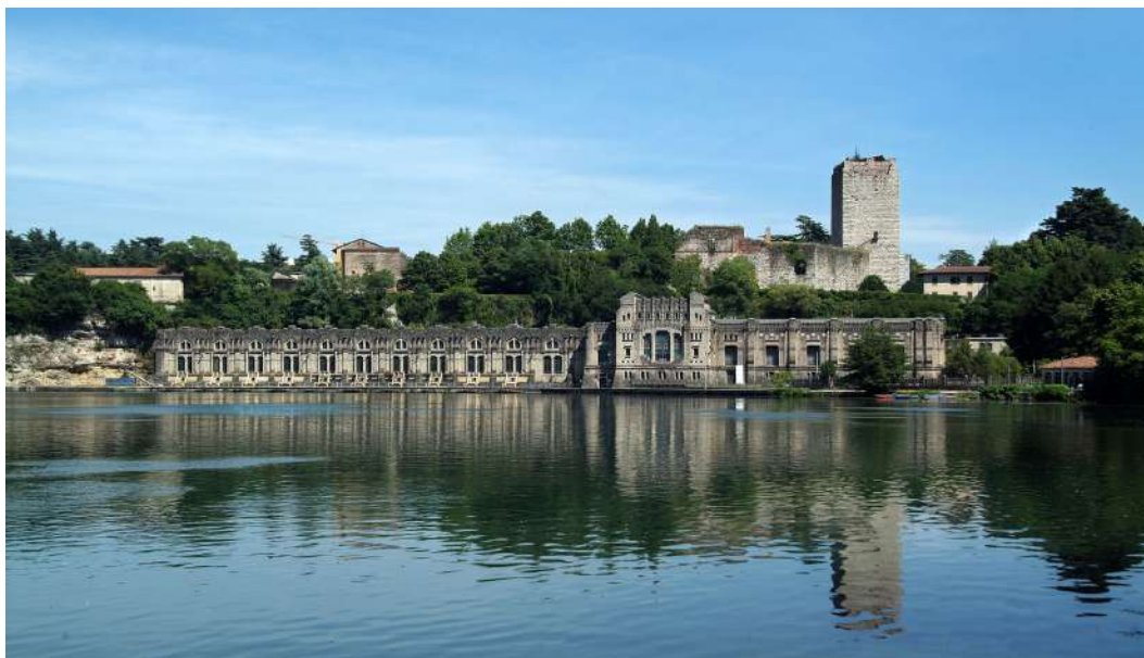
Figura 1. Centrale Benigno Crespi, Trezzo d'Adda (Milano, Italia). Prospetto principale della centrale e retrostante castello medievale.

continui interventi di manutenzione, segnano oggi come in passato i territori montani e, benché al momento della loro realizzazione avessero suscitato notevoli polemiche per il loro forte impatto sul territorio 3 , oggi non sono pressoché più percepite come elementi artificiali, poiché totalmente inglobate nel paesaggio. Le seconde viceversa, venute meno le ragioni e le esigenze per cui erano state realizzate, sono state abbandonate al loro destino e si stagliano nel paesaggio come lacerti privati del loro significato. Questi reperti rappresentano segni del progresso, della rivoluzione e dello sviluppo industriali, ma anche segni delle sofferenze e delle difficoltà che, affrontate e superate dalle generazioni che ci hanno preceduto, hanno reso possibile le attuali condizioni di vita (Di Battista, 2011).