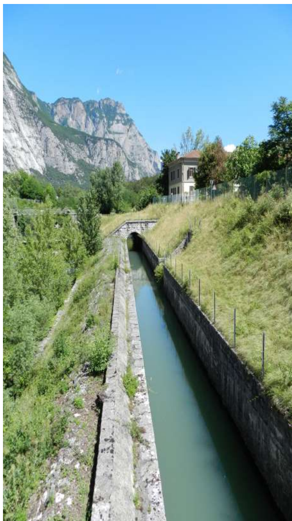
Figura 3. Patrimonio dell'idroelettricità: canalizzazione scoperta in prossimità della centrale di Fies (Trento, Italia).