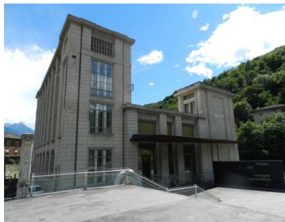
Figura 7. Museo dell'energia idroelettrica. Cedegolo (Brescia, Italia).