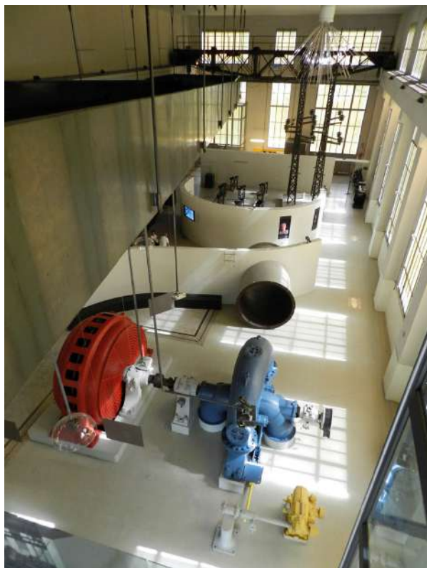
Figura 6. Museo dell'energia idroelettrica. Cedegolo (Brescia, Italia). Particolare del percorso espositivo.

como vertiente del turismo cultural, conecta la geografía del turismo con los itinerarios a las huellas y vestigios de la industria y también a su patrimonio vivo: factorías, centrales eléctricas, minas, puentes, canales, altos hornos, imprentas, cerámicas y cementeras, todo un conjunto de elementos o monumentos de la industria que describen sendas cargadas de historia y simbolismo (Álvarez Areces, 2017, p. 133),