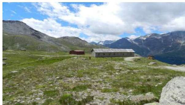
Figura 5. Valtournenche (Val d'Aosta, Italia). Stazione di arrivo della strada ferrata e baracche degli operai in prossimità della diga del Goillet.

L'evoluzione di cui è stato protagonista il concetto di patrimonio a partire dalla seconda metà del XX secolo ne ha determinato una progressiva estensione tipologica, cronologica e geografica 4 e ha visto di conseguenza l'incremento e l'ampliamento delle categorie di beni individuabili come testimonianze materiali [e immateriali] aventi valore di civiltà 5 e, in quanto tali, da preservare e da trasmettere ai posteri. Secondo quanto sancito in Italia dal Codice dei Beni culturali e del paesaggio, il patrimonio culturale è costituito dai beni culturali e dai beni paesaggistici (D. Lgs. 42/2004 e s.m.i., art. 2, comma 1) che comprendono tanto