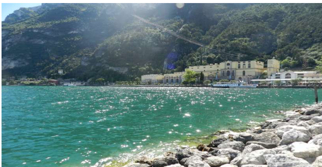
Figura 2. Centrale del Ponale, Riva del Garda (Trento, Italia). Prospetto principale della centrale.