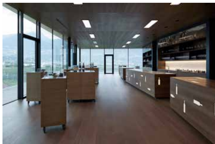
Cantina Merano Burggräfler a Marlengo (Merano, BZ).

La scorsa estate abbiamo terminato la cantina Merano. Al momento non abbiamo più incarichi in questo ambito, ma si spera di averne nuovamente in futuro.