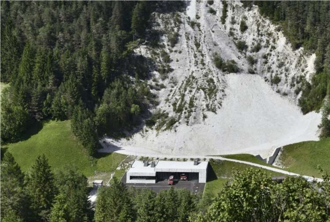
(1. Ph. Credits Oskar Da Riz)