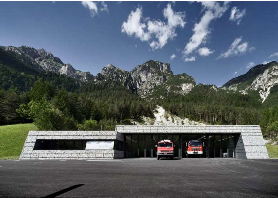
(2. Prospetto)