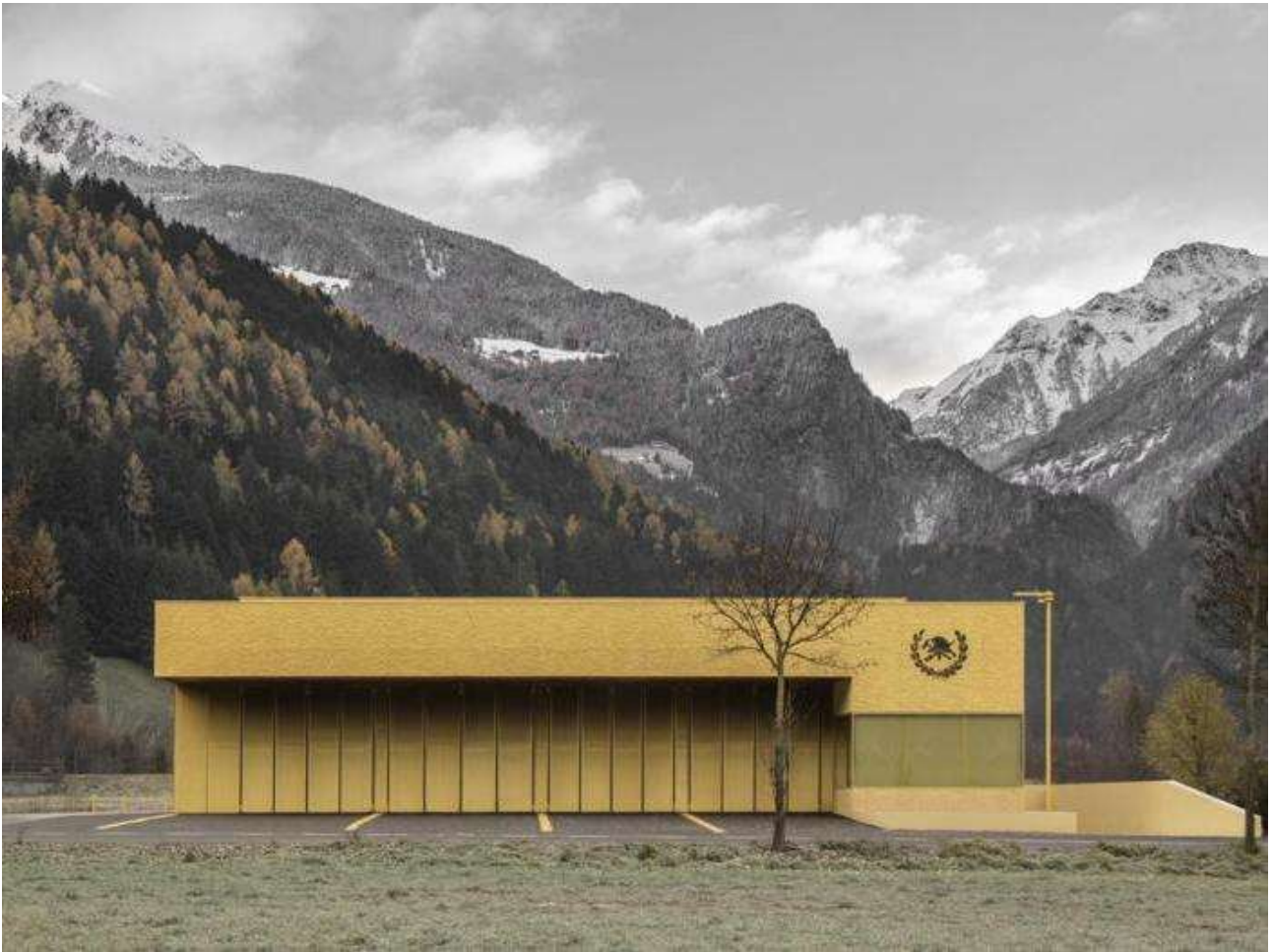
(10. Ph. Credits Pedevilla Architects)

L'ultimo intervento di questa sezione è la caserma "dorata" di Campo Tures (Bolzano) firmata Pedevilla diventata un landmark per la colorazione dell'intonaco che rispecchia la gamma di colori tipici della stagione autunnale, integrandosi cromaticamente con la vegetazione.