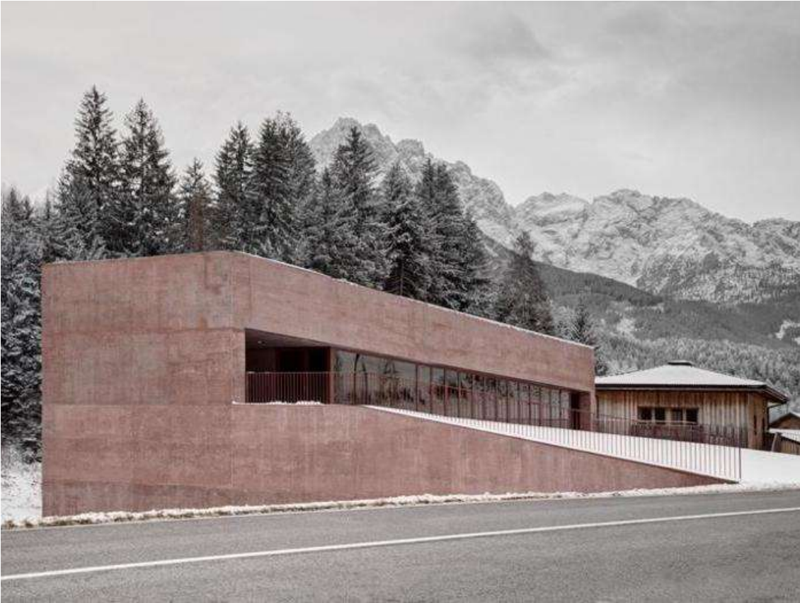
(8. Prospetto su strada)