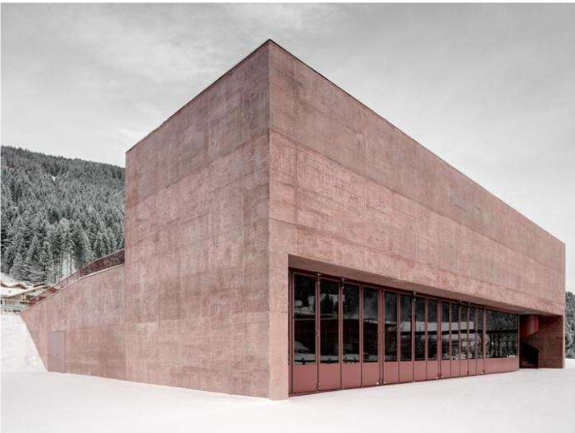
(9. Prospetto interno)