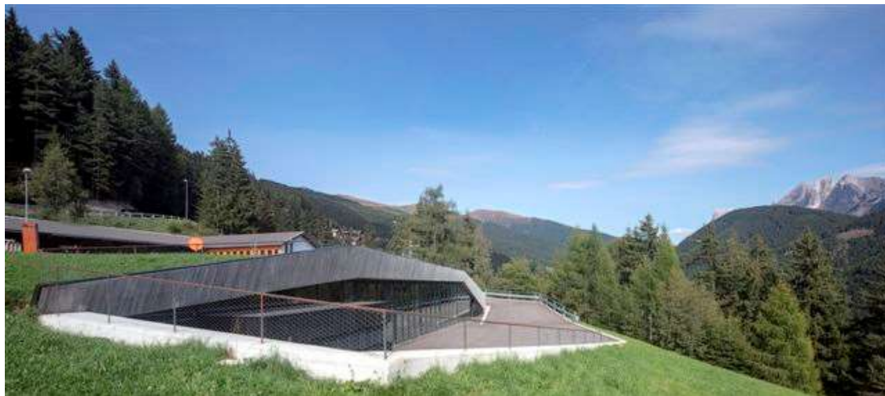
(5. Ph. Credits Richard Günther Wett)

Questo approccio al progetto, che integra concretamente l'architettura nella materia, è stato adottato anche dallo studio dell'architetto Christian Schwienbacher per la caserma dei Vigili del Fuoco della frazione di Eores (Bressanone, Bolzano), inaugurata nell'ottobre del 2016. I progettisti hanno scelto di creare una struttura ipogea per non deturpare la percezione del paesaggio e la vista sulla valle. Infatti, anche attraverso la parete finestra, lo spazio interno fluisce ed interagisce con l'esterno, in particolare quando le chiusure sono aperte. Inoltre, gli spazi e le altezze interne sono plasmate in relazione ai mezzi che verranno ospitati ma soprattutto adattandosi alla morfologia del terreno