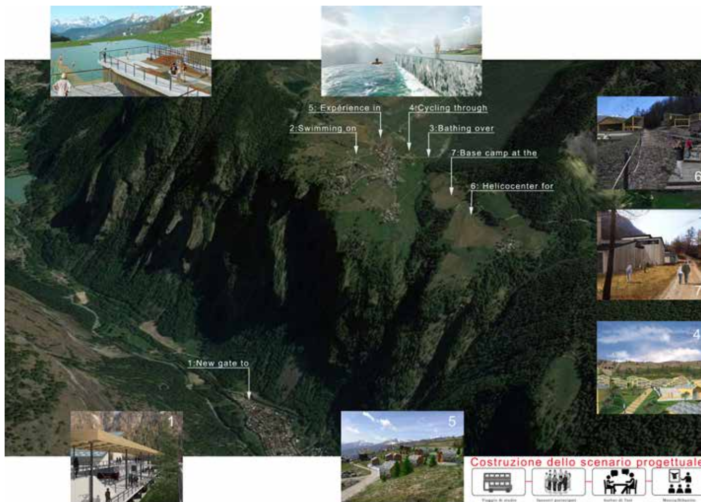
Le aree di approfondimento progettuale, corrispondenti a funzioni specializzate per l'attrattività turistica, per la ricettività e per il lavoro, localizzate sia alla partenza della funivia che collega Buisson (Antey-Saint-André) a Chamois, sia nel territorio di Chamois stesso.

L'obiettivo della collaborazione tra Comune e Dipartimento – siglata in forma di convenzione di ricerca finalizzata alla elaborazione di prefigurazioni progettuali – non è stato focalizzato sulla definizione di abachi, regole o prefigurazioni per singoli manufatti architettonici nearly zero emissions .