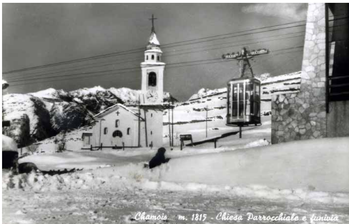
Chamois m. 1815 - Chiesa Parrocchiale e funivia

Una cartolina invernale degli anni cinquanta con la cabina della prima funivia e l'originaria stazione di attestamento in località Corgnolaz.