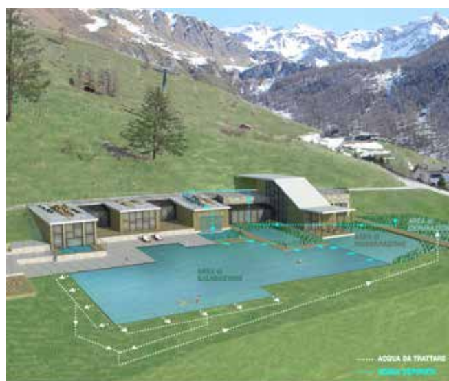
Studenti: Francesco Demagistris, Sepideh Vadidar.

A Chamois, in località Corgnolaz, un balcone naturale di ampie dimensioni affacciato in posizione panoramica e soleggiata sui versanti della Valtournenche, ora utilizzato come campo sportivo, viene ripensato come area di loisir legata all’acquaticità estiva e invernale: la biopiscina è strutturata come nuovo paesaggio costruito, disegnato dal patchwork di aree umide che cor-