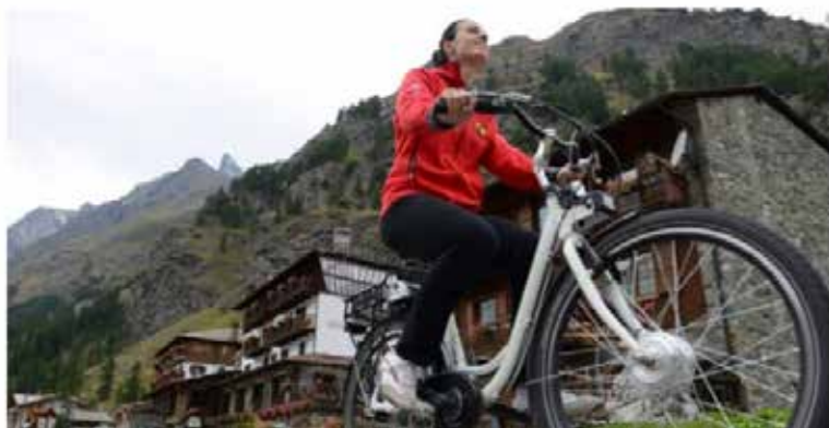
"Rè.V.E. - Grand Paradis - Rete Veicoli Elettrici Grand Paradis", uno dei tre "Nominated Project" dell'edizione 2017 dell' UIAA "Mountains Protection Award".

The project enhanced the natural and cultural characteristics of the Aosta Valley side of the Gran Paradiso National Park, allowing slow and zero-impact trips where it was possible. This was achieved by implementing a responsible and ethical management of available resources and encouraging the convergence of interests and contributions in the various decision-making processes. The Rève Grand Paradis project combined the interests of regional and local administrations, local tour operators, tourists and residents in the concerned areas, creating a free service for everyone. The Rève Grand Paradis bike sharing system – now managed by the local authorities – is still used by locals for their daily trips, young locals to spend their leisure time, tourists visiting the area, tour operators as an additional offer to their clients, the territorial administrations for institutional purposes and events on the territory.