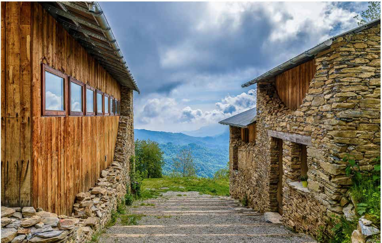
Paraloup, "La montagna che rinasce", nominated project all'UIAA "Mountains Protection Award" 2017.

versità e sulla ricerca scientifica su temi locali, conoscenza trasferita alle comunità attraverso scuole di istruzione e formazione. Diverso ma egualmente interessante il progetto "Mountain Wilderness": vincitrice dell'edizione 2016 un'iniziativa francese dedicata principalmente