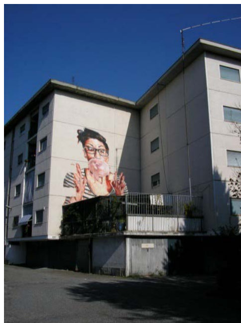
Figura 9 - Esempio di murales e di percorso a tema a Falchera Nuova. Elaborazioni realizzate da Roberta Giaconi e Elisa Cosso