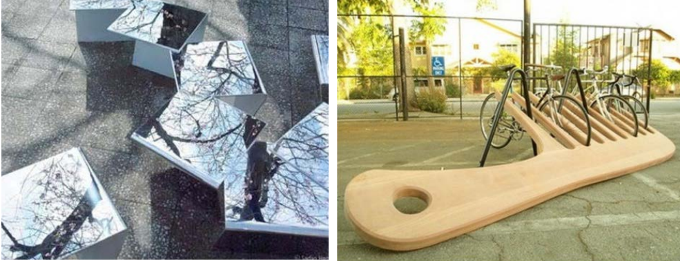
Figura 8 - Left: Mount Fuji Architects Studio, In Flakes. street furniture. Towada, from ( http://officinamarcovaldo.blogspot.com/search/label/arredo%20urbano ); Right: Knowhow Shop LA, Comb Bike Rack, Roanoke, Virginia, ( http://officinamarcovaldo.blogspot.com/search/label/arredo%20urbano )