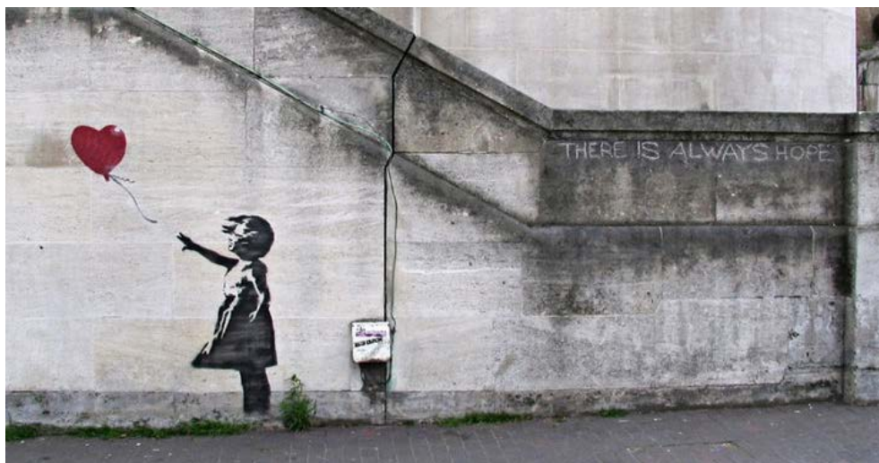
Figure 3 - Banksy, The girl letting go of a heart-shaped balloon is one of the artist's most famous works.

Fra i maggiori protagonisti dell'arte urbana nella contemporaneità, vi è Banksy, artista inglese, uno dei maggiori esponenti della Street Art [21]. Le sue opere - messaggi e raffigurazioni dal tratto immediato, quasi silhouette, a sfondo polemico-satirico e politico - sono realizzate tramite la tecnica dello stencil . L'artista cerca di dialogare attraverso la realtà urbana, rifiuta ogni appartenenza a gallerie, movimenti o social network , proprio al fine di mantenere libera la propria arte, tanto da far sì che questa sia stata definita Guerrilla art . Un'ulteriore declinazione della Street Art ad alto contenuto ironico è data da Blu, pseudonimo di un artista bolognese, presente sulla scena artistica dal 1999. Inizialmente la sua pratica pittorica, pur esprimendo fin da subito elementi di originalità stilistica, era legata all'uso della bomboletta spray, strumento tipico del writing tradizionale. Già a partire dal 2001 le opere di Blu iniziano ad essere eseguite con vernici a tempera e con l'uso di rulli montati su bastoni telescopici in modo da ingrandire notevolmente i soggetti raffigurati dandogli maggior visibilità e efficacia comunicativa, tanto che nel 2011 il giornale britannico " The Guardian " l'ha segnalato come uno dei dieci migliori street artist oggi attivi [8]. Particolarmente significativa risulta la contaminazione fra elementi architettonici e figurativi a per comunicare, verso una traduzione del conosciuto, nel rappresentato di cui parla il