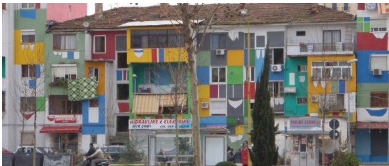
Figura 2 - Alcune facciate colorate a Tirana, in ( http://sardarch.wordpress.com/2009/09/24/tirana-arcobaleno-dall%E2%80%99est/ )

Figure 2 - A few colourful facades in Tirana, from ( http://sardarch.wordpress.com/2009/09/24/tirana-arcobaleno-dall%E2%80%99est/ ).