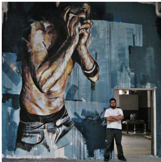
Figura 5 - Fabrizio Visone, murales realizzato alla fabbrica di via Foggia, Torino, progetto Urbe Rigenerazione Urbana, 2011 – murales realizzato al Street art Festival 2011 di Campobasso; ( www.fabriziovisone.com ).