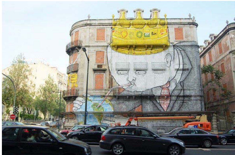
Figure 4 - A Blu and Os Gemeos' large mural painted in 2010 on a building in Lisbon. ( http://blublu.org/ )

Figura 4 - BLU, 2010, Blu in collaborazione con Os Gemeos realizza un grande murales su un palazzo di Lisbona. ( http://blublu.org/ ).