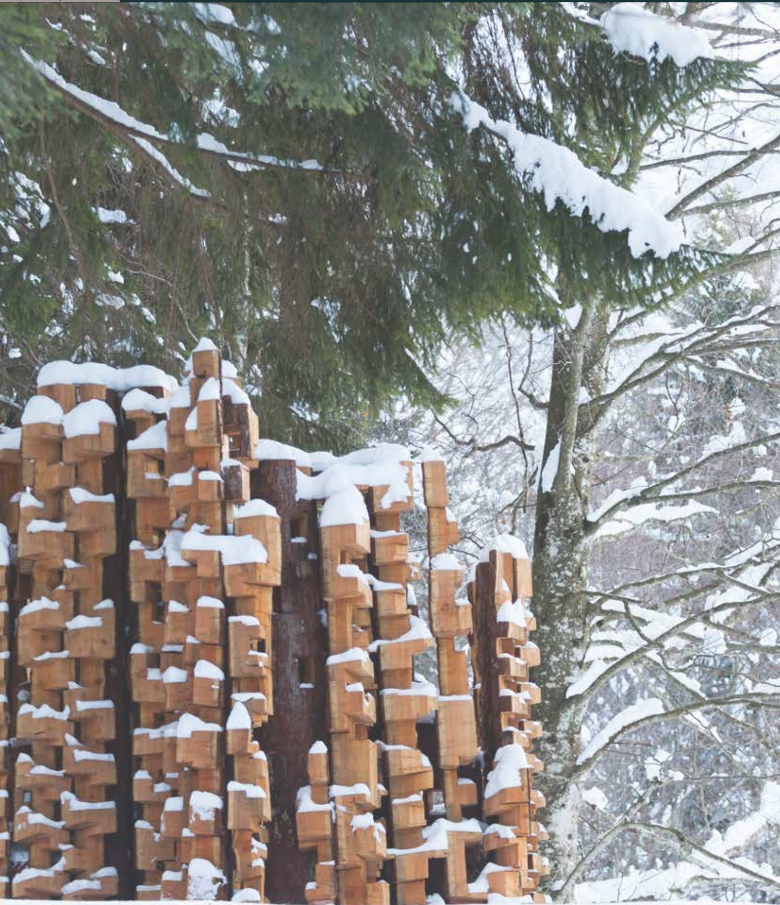
Urs Twellmann, Bosco geometrico (©Arte Sella, fotografia di Giacomo Bianchi).