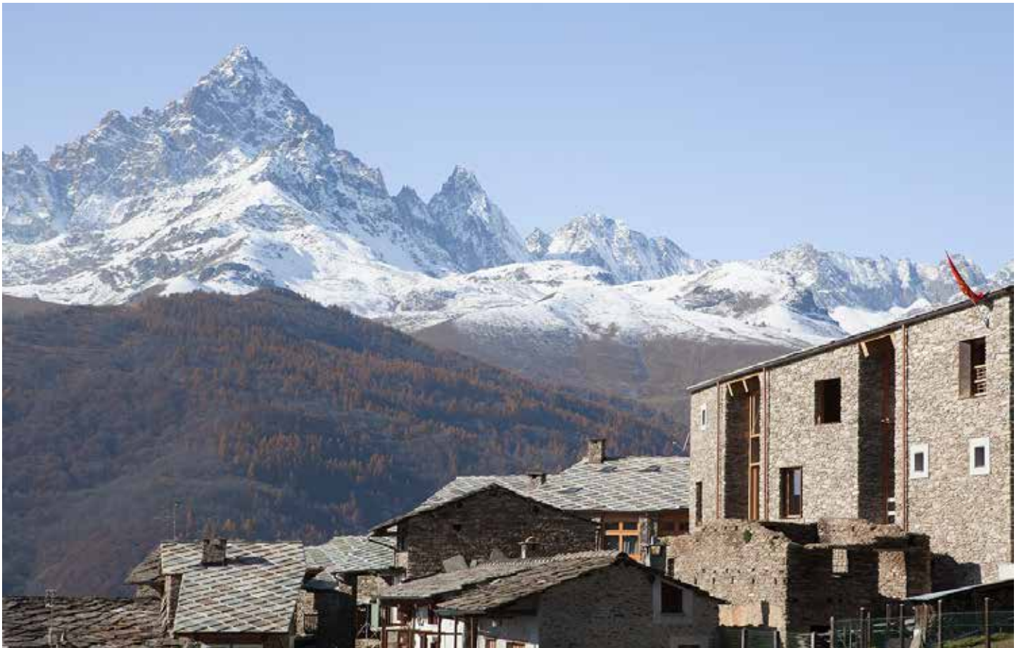
Il nuovo centro culturale e la borgata Miribrart sullo sfondo del Monviso.

A tal proposito, l'amministrazione di Ostana ha avviato da tempo una politica di sensibilizzazione verso l'architettura locale che ha consentito, dapprima, una presa di coscienza del valore dell'architettura rurale e, di conseguenza, della necessità che gli interventi – principalmente i recuperi di seconde case, ma an-