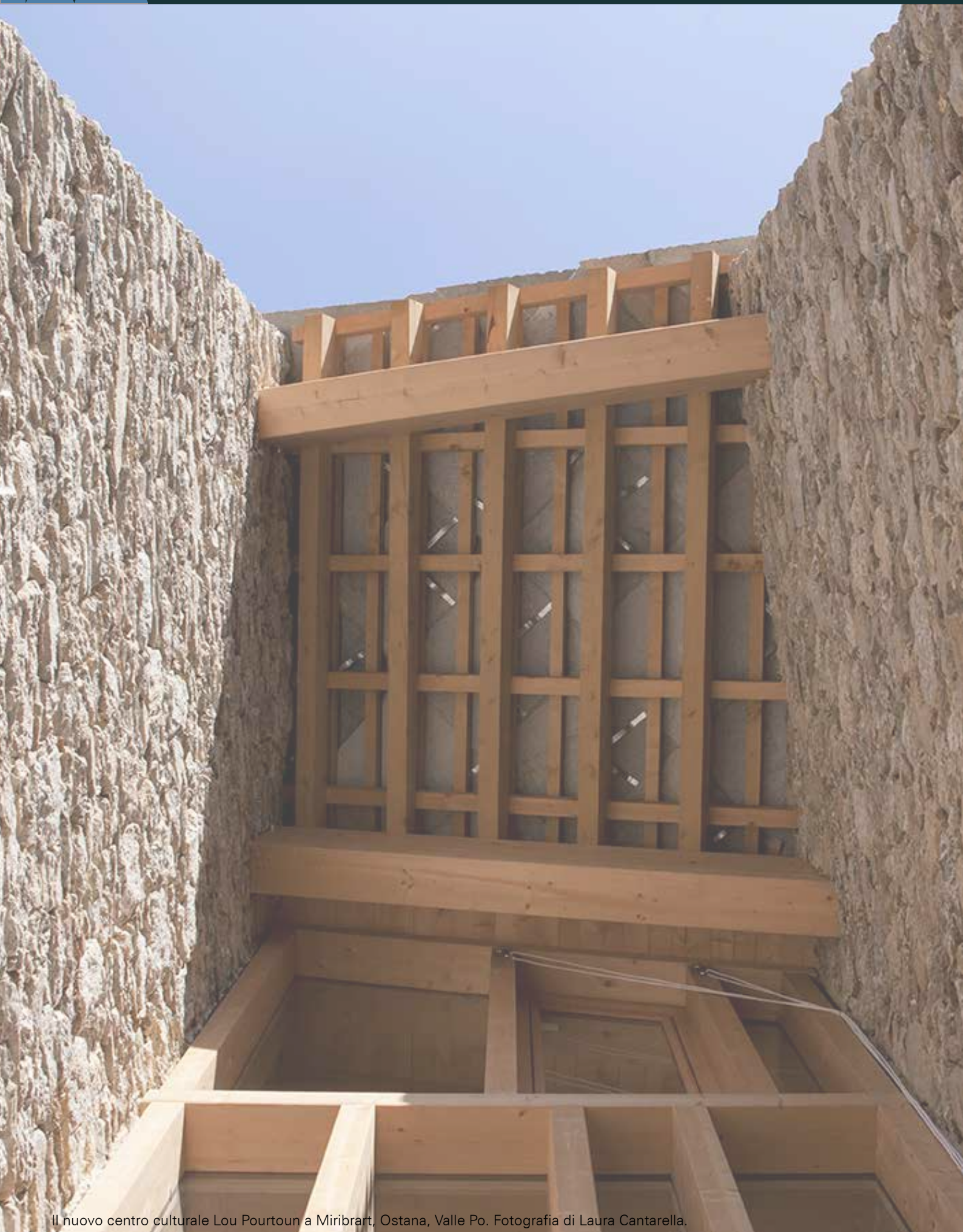
Il nuovo centro culturale Lou Pourtoun a Miribrart, Ostana, Valle Po.