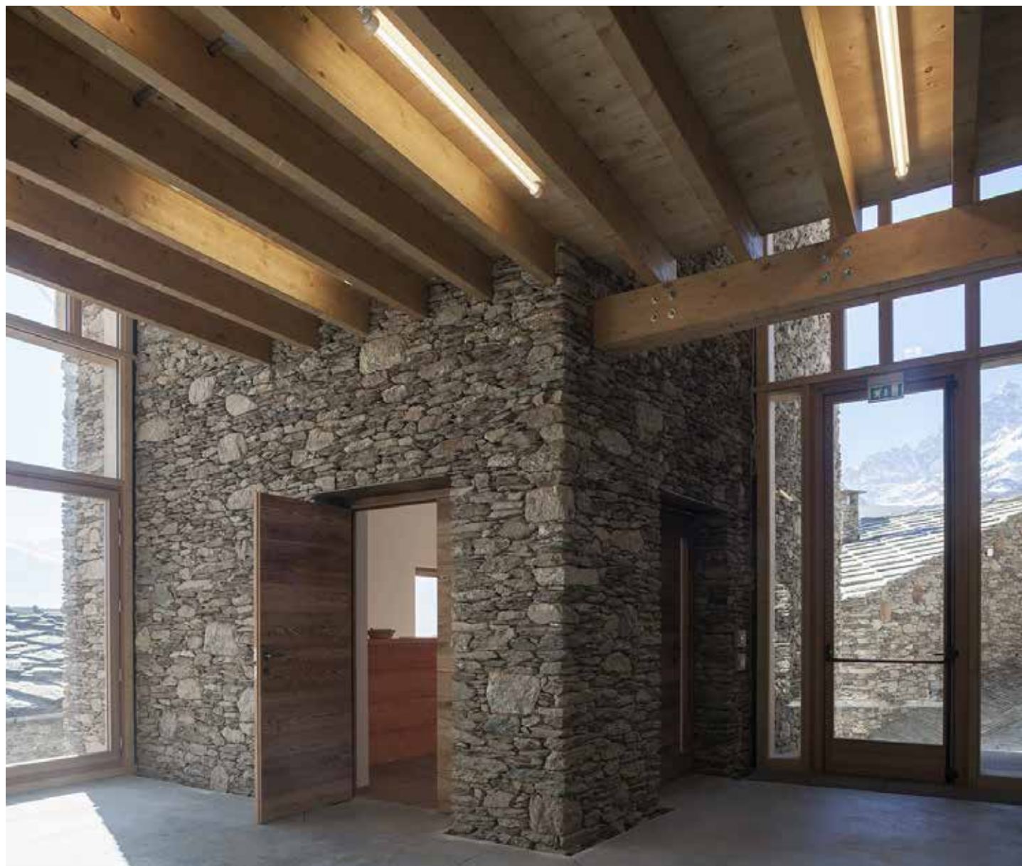
Una delle celle recuperate vista dallo spazio distributivo del pourtoun.

Questo insieme di interventi, così articolati e diversificati, hanno rappresentato per i progettisti un'occasione di sperimentazione sul campo di soluzioni che sapessero mettere in gioco un linguaggio architettonico contemporaneo, in un contesto particolare e sensibile come quello alpino, attraverso un'attenta ibridazione dei materiali e delle tecniche locali con l'innovazione tecnologica e degli elementi costrut-