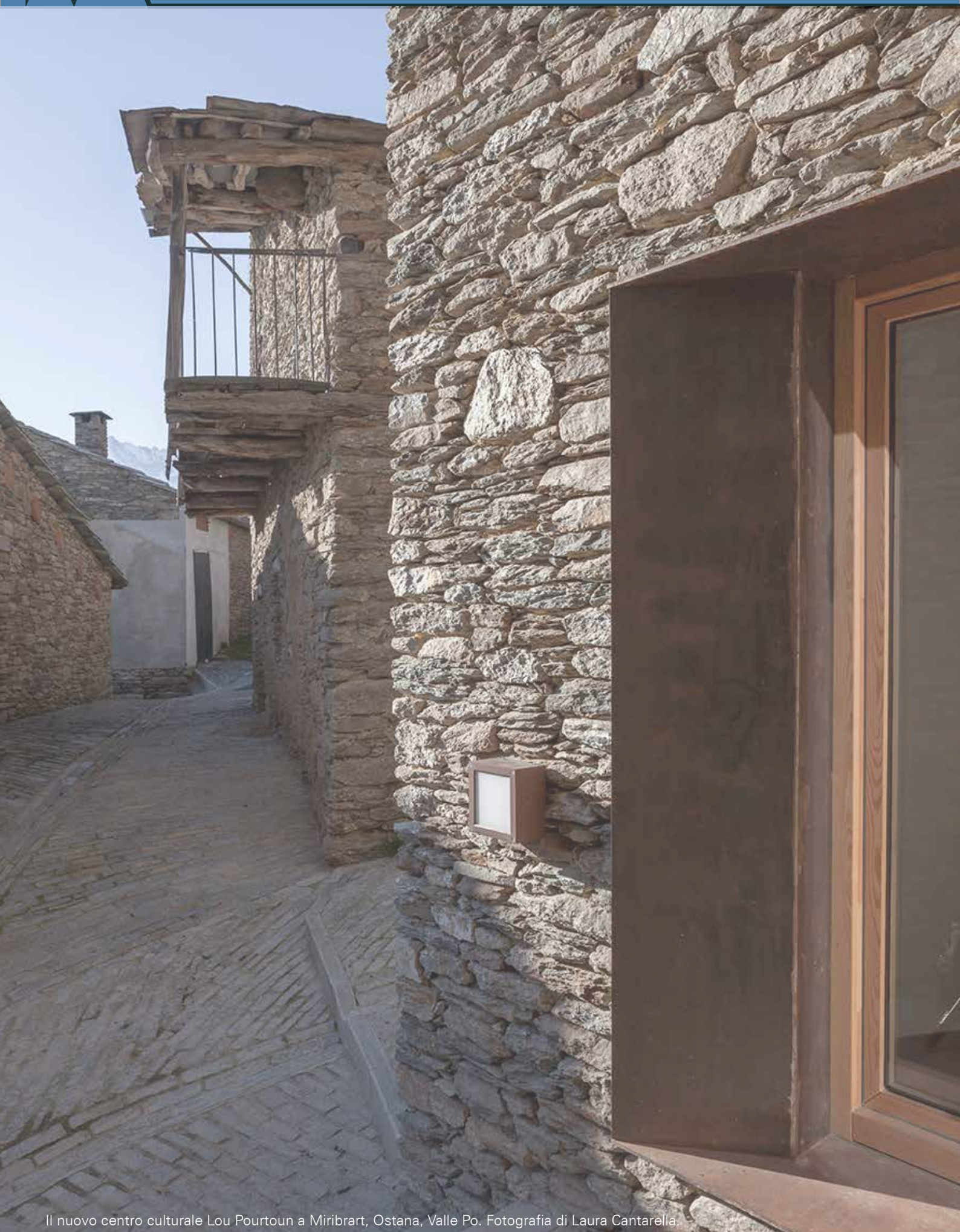
Il nuovo centro culturale Lou Pourtoun a Miribart, Ostana, Valle Po.