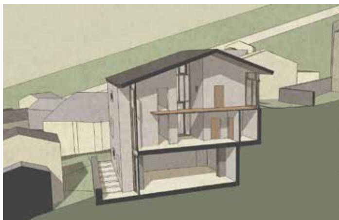
Sezione assonometrica di progetto (elaborazione 3D di Marie-Pierre Forsans).

Concludendo, dopo solo qualche settimana di vita può non sembrare un azzardo affermare che, fin dalle premesse, questo nuovo intervento per il comune di Ostana sembra proprio bene rappresentare – tanto nell'articolazione del suo programma funzionale, quanto nella sua figurazione architettonica – il cambio di paradigma di quei territori montani che, con lentezza e fatica, stanno sostituendo l'immagine del degrado e dell'abbandono, con quella di nuovi potenziali territori per l'abitare contemporaneo.