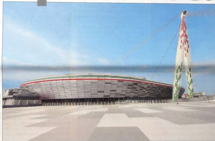
Ma l'unica a passare dalle intenzioni ai fatti è la Vecchia signora. Il nuovo stadio della Juventus è stato inaugurato l'8 settembre a Torino in sostituzione del mai amato Delle Alpi; per il momento, è l'unico impianto italiano di proprietà privata di un grande club calcistico

SPECIAZIONE IN A.P. - 45% D.L. 35/2003 (CONV. IN L. 27/02/2004 N° 46) ART. 1, COMMA 1, DCE TORINO MENSILE N. 98 OTTOBRE 2011