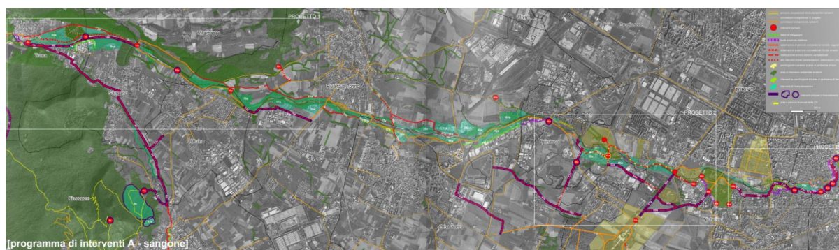
Figura2. Masterplan Corona Verde II: Valorizzazione ambientale e fruibilità della fascia fluviale del Sangone

Nonostante la limitata adesione politica di alcuni comuni, il CdF ha inoltre assegnato alle istituzioni e alle popolazioni locali un ruolo centrale nella ricostruzione del paesaggio in un territorio fluviale debole, orientando l'attenzione non solo verso il tema dell'acqua, dell'uso del suolo, della sicurezza e dell'assetto idrogeologico, ma anche verso la costruzione di reti ecologiche e fruibili per la qualità della vita. Il programma si è svolto secondo processi e procedure consolidate nei CdF (tavoli di lavoro, conferenze e workshop); innovativa è la territorializzazione delle azioni nel Masterplan del Piano d'Azione per definire progetti alla scala vasta del fiume e del suo territorio, fornendo indicazioni per i piani e per il progetto di singoli nodi alla scala locale.