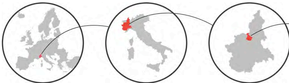
Figura 1 | Inquadramento dell'area di studio. Elaborazione: R. Germano, 2014.

Il paesaggio "osservato" è quello di uno degli anfiteatri morenici meglio conservati in Europa: segnato dai confini netti dei cordoni morenici e ricco di risorse naturali e culturali. Nel secolo scorso, lo sviluppo di Ivrea e del territorio fu legato all'industria Olivetti, tuttavia oggi l'intera area è in cerca di una nuova identità. Il panorama dell'associazionismo attivo su tematiche territoriali e paesaggistiche è ricco e, probabilmente, sintomo di questa fase.