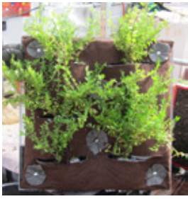
02 | Prototipo del sistema parete GRE_EN_S GRE_EN_S prototipo