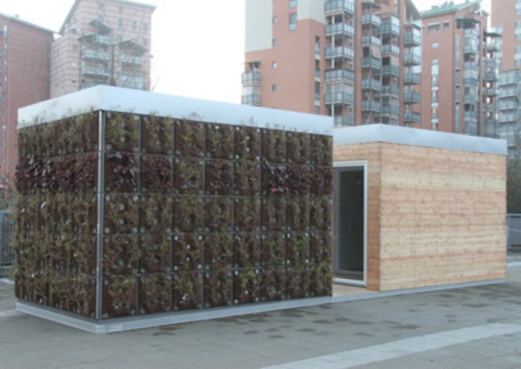
05 | I due blocchi dell'edificio campione Modular installation with GRE_EN_S LWS

LCA, dalla scelta dei materiali, alle modalità di assemblaggio, fino alla fase di esercizio e fine vita, consenta di migliorare le prestazioni tecnologiche e ambientali del sistema.