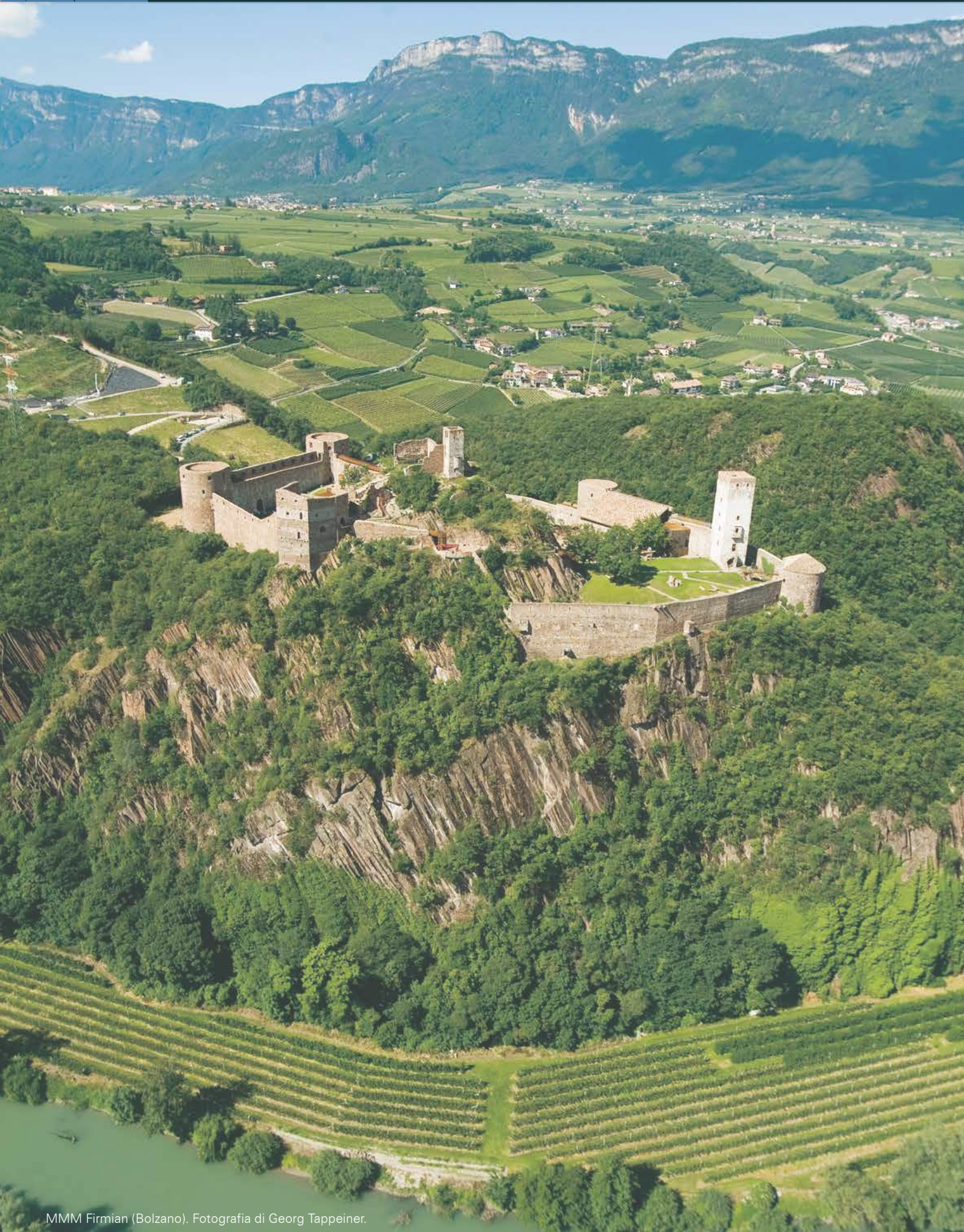
MMM Firmian (Bolzano).