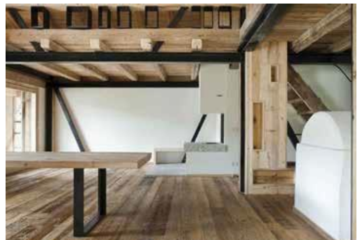
Selva di Cadore, Belluno. Recupero di un Tabià, 2010, Exit architetti.

Le attività che venivano svolte dagli abitanti di un tempo si riflettevano chiaramente nella disposizione degli ambienti e nelle loro dimensioni: fienili, cantine e stalle occupavano la maggior parte della superficie disponibile mentre gli ambienti strettamente legati alla vita dell'uomo si configuravano negli esigui spazi