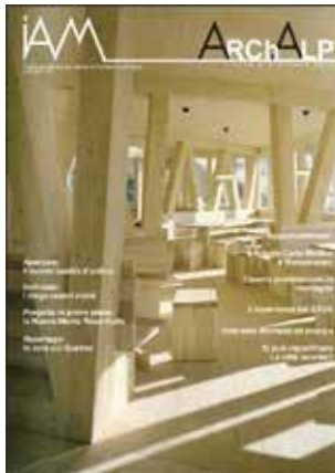
ArchAlp0 Numero zero