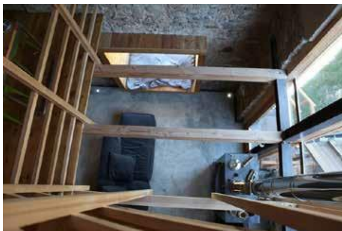
Trasformazione di un vecchio fienile di montagna. La pavimentazione del piano terra è realizzata in cemento spatolato, architetto Dario Castellino.

La tesi evidenzia l'opportunità che negli interventi sugli elementi esterni si eviti di alterarne in maniera incongrua proporzioni e caratteri; qualsiasi mutamento, infatti, seppur minimo, può minare – se non addirittura cancellare – l'identità e i valori culturali del contesto abitato, compromettendone inevitabilmente aspetti tipici e irrinunciabili della cultura e della civiltà alpina.