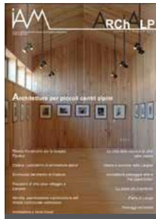
ArchAlp1 Architetture per piccoli centri alpini