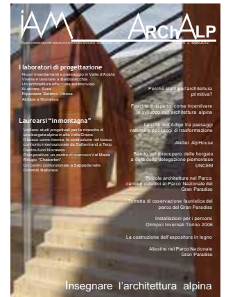
ArchAlp3 Insegnare l'architettura alpina