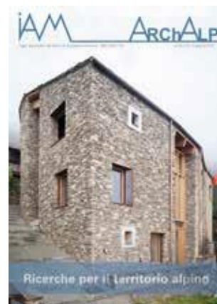
ArchAlp9 Infrastrutture e infrastrutturazione delle Alpi

Infrastrutture e infrastrutturazione delle Alpi