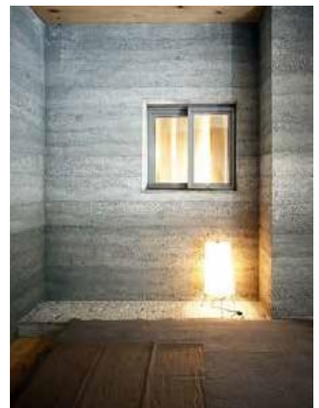
Soglio. Riqualificazione di una stalla, architetto Armando Ruinelli.