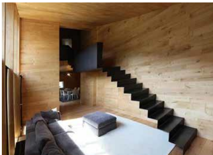
Scala a sbalzo in struttura metallica piegata e incastrata nel muro, architetto Dario Castellino.