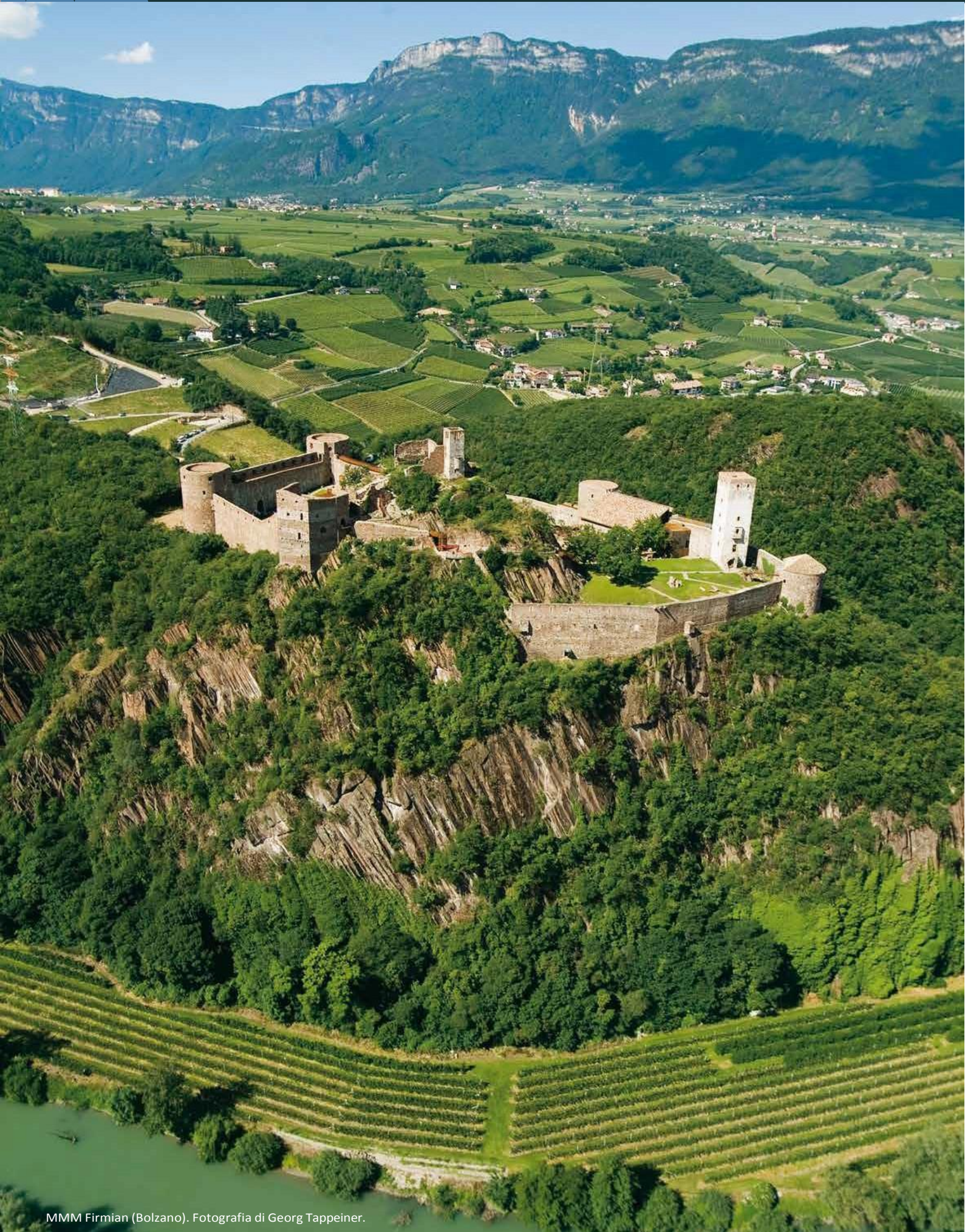
MMM Firmian (Bolzano).