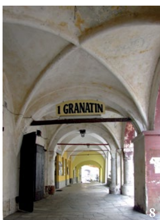
3. Il sito di Villafranca, segnato dal campanile trecentesco di Santo Stefano, ripreso da oltre il Po, dalla strada per Moretta. 4. Asse retto del borgo di Musinasco (via Matteotti), ripreso verso il ponte sul Po. 5. Case porticate lungo l'asse retto, lato nord. 6. Asse principale di borgo Soave (via Roma), ripreso da ovest. 7. Strada dell'impianto regolare di borgo Soave (via Roppolo). 8. Casa medievale lungo l'asse retto di Musinasco, lato nord. 9. Santo Stefano, abside e campanile.