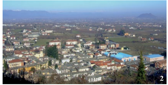
1. Il borgo vecchio e la chiesa di San Giovanni Battista, ripresi dalla salita al Castelnuovo superiore. 2. La trama regolare del borgo inferiore, vista dal Castelnuovo superiore; a destra la rocca di Cavour.