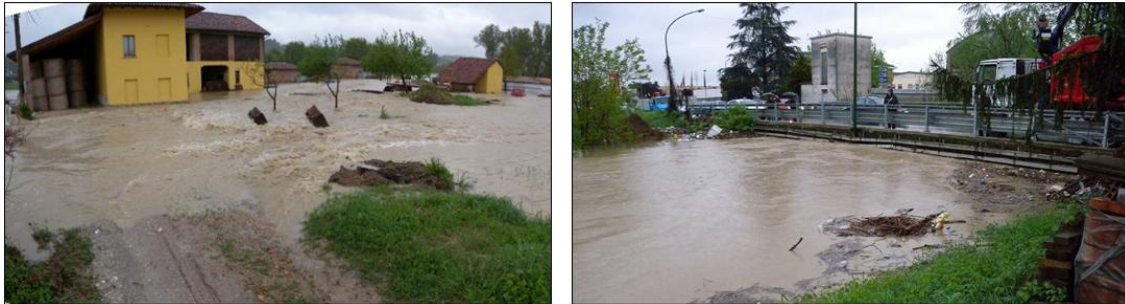
Figura 1: Cascina Gala (Comune di Castell'Alfero) e Ponte di C.so Alessandria (Comune di Asti) - Evento del 27 aprile 2009

La necessità di realizzare dei modelli realistici di simulazione delle piene e di sviluppare l'analisi di fattibilità per interventi di mitigazione della pericolosità idraulica, scaturisce pertanto dalle sempre più frequenti esondazioni del torrente Versa che, sia storicamente che attualmente, stanno coinvolgendo importanti aree (urbanizzate e non), causando al contempo l'interruzione di importanti arterie viarie di collegamento.