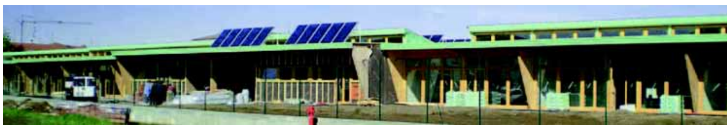
Scuola materna di Trecate (No), arch. G. Pomatto.