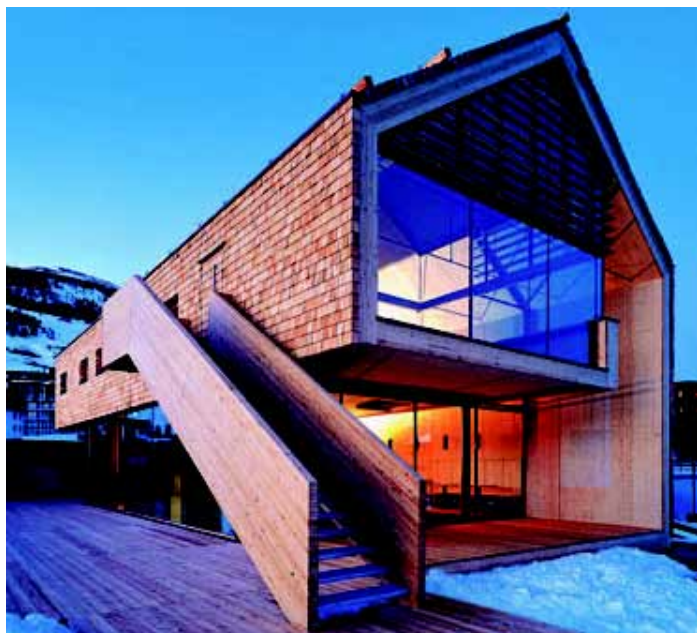
Sestriere, Casa Austria, LP architektur ZT GmbH. Olimpiadi invernali Torino 2006.