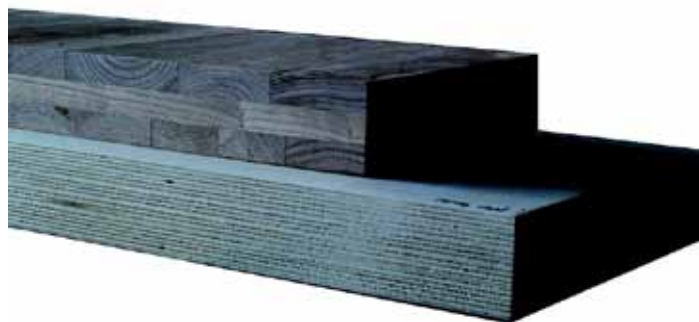
Pannelli lamellari di castagno e pioppo di origine piemontese.

Nella prospettiva di creare maggiori opportunità di sviluppo per i territori montani, la Provincia di Torino