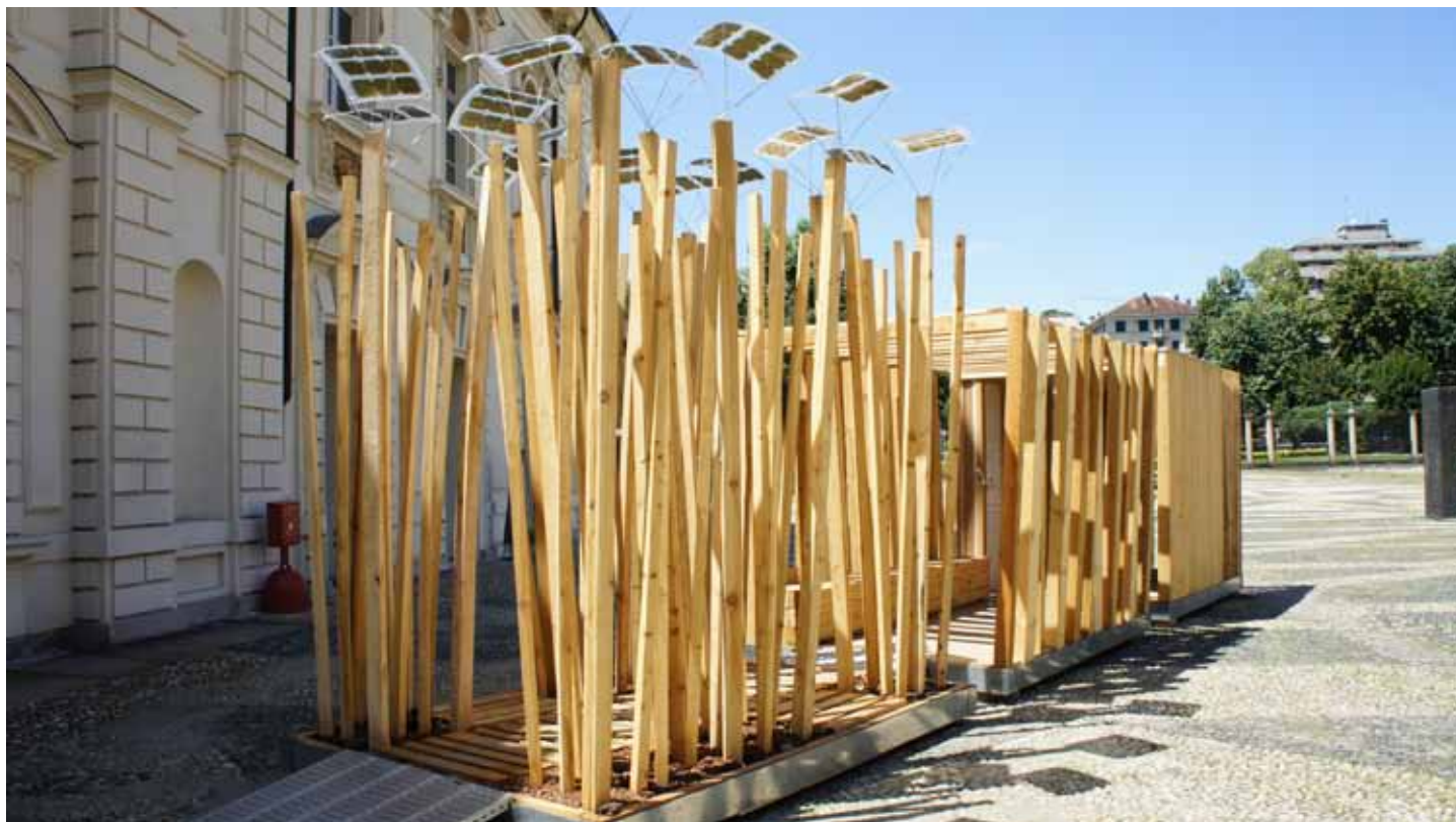
Workshop "Il senso del legno". Torino, Castello del Valentino.