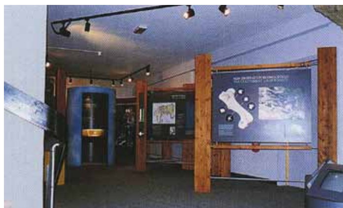
Viste degli espositori

La componibilità, come concetto preso a prestito dalla serie, va intesa qui come principio di flessibilità indispensabile per l'exhibit; ciò significa la possibilità di prevedere una rosa ristretta di elementi – base, da integrare in tempi successivi con soluzioni e con nuovi elementi (menso-