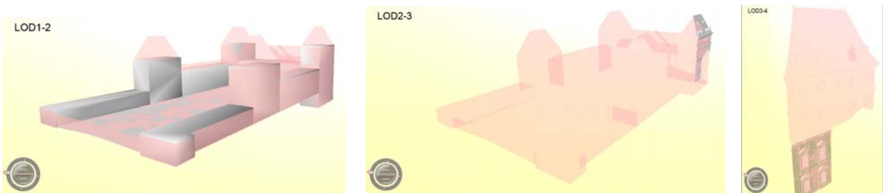
Figura 2: differenti porzioni del complesso implementate nei diversi livelli di dettaglio.

Lo standard City GML supporta 5 LODs, ognuno dei quali comprende specifiche classi geometriche e tematiche dei dati, e tra i quali il più dettagliato corrisponde ad una tipica scala di rappresentazione architettonica (1:100). La documentazione del patrimonio architettonico-culturale è generalmente attestata sulla scala 1:50, che è stata utilizzata in questo studio, principalmente per la rappresentazione delle caratteristiche dei fronti storici dell'edificio, assegnando ad essa un nuovo LOD che integra la sequenza individuata dall'OGC per il CityGML. Per realizzare l'implementazione complessiva è stato creato un modello architettonico al LOD più elevato e uno schema bidimensionale dei diversi LOD, sulla base dei quali sono stati derivati i modelli tridimensionali. Modelli complessivi del castello sono stati implementati ai LOD 1 e 2, mentre soltanto porzioni specifiche della fabbrica sono state modellate per testare il popolamento dei livelli di dettaglio superiori: un fronte della torre Sud-Est, incluso il tetto, è stato implementato al LOD3, mentre soltanto due livelli dello stesso fronte sono stati modellati al dettaglio richiesto dal LOD4.