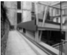
Fig. 3b. Torino, Palazzo San Liborio, vista della copertura all'interno del cortile.

importanza, costituito dal sito dell'antica basilica paleocristiana dedicata al Salvatore.