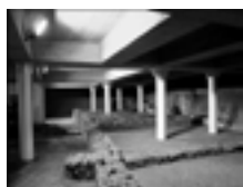
Fig. 2b. Torino, parcheggio Palazzo, vista dei resti archeologici.

dell'Archivio Storico che si sviluppa al suo intorno (figg. 1a-1b). La seconda area di studio è ubicata all'interno di un parcheggio pubblico in parte interrato e in parte fuori terra ai margini della zona storica, dove sono stati rinvenuti i resti di un edificio extraurbano di età romana. Si tratta di una serie di ambienti organizzati secondo uno schema regolare, che costituivano il blocco occidentale dell'intera fabbrica che, intervallata da un cortile centrale, constava di un'insieme di vani, molto frammentari, nel settore orientale. L'assetto attualmente visibile è quello relativo all'ultima fase di utilizzo, durante la quale negli ambienti affacciati verso il cortile, erano stati ricavati due grandi magazzini caratterizzati dalla presenza di fosse circolari, probabilmente silos interrati, allineati su due file. Il settore orientale ospitava invece ambienti costituiti in parte da materiali deperibili, per questo non conservati se non limitatamente alle porzioni carbonizzate da un incendio. Essi corrispondevano probabilmente a granai sospesi. È ipotizzabile, quindi, che l'intero complesso corrispondesse a un ampio sistema di magazzini, alcuni dei quali destinati alla conservazione a breve termine (granai sospesi), altri a quella a lungo termine (silos interrati) 2 .