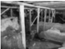
Fig. 1b. Torino, via Barbaroux 32, vista dei resti archeologici con la struttura di copertura e le opere provvisorie di consolidamento.

Per l'area di Torino sono state scelte - all'interno di un elenco/regesto redatto dalla Soprintendenza per i Beni Archeologici del Piemonte e dal Settore Edifici per la Cultura - Divisione servizi tecnici ed edilizia per i servizi culturali-sociali-commerciali - della Città di Torino, costituito da 17 siti urbani ubicati all'interno della zona centrale di Torino, delimitata anticamente dal perimetro a forma di quadrangolo con un angolo smussato della città Julia Augusta Taurinorum - tre aree di proprietà pubblica e una di proprietà privata, ritenute particolarmente significative.