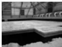
Fig. 4b. Torino, piazza San Giovanni, resti del pavimento a mosaico.