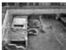
Fig. 2a. Torino, il settore occidentale del complesso edilizio extraurbano di età romana nell'area del parcheggio Palazzo in corso XI Febbraio, al termine dello scavo, nel 1997, Archivio fotografico della Soprintendenza per i Beni archeologici del Piemonte e del MAE.