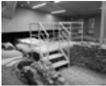
Fig. 3a. Torino, Palazzo San Liborio, vista dei resti archeologici musealizzati.