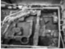
Fig. 1a. Torino, veduta degli scavi all'interno del cortile dell'Archivio Storico della Città di Torino, in via Barbaroux 32, nel 1996, al termine delle indagini.

progetto della luce e tecniche di illuminazione; tecniche di commento.