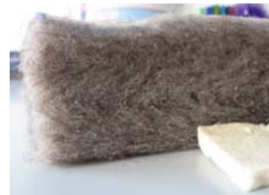
03 | Confronto tra un pannello isolante in lana e CARTONLANA (in basso a destra). CARTONLANA è più sottile e autoportante rispetto ai pannelli tradizionali

they have the suitable characteristics for producing felts and thermal insulation materials. Nevertheless the production of insulation material is often made with raw wool coming from Austria and New Zealand, except for some enterprises committed in promoting insulation material «made in Italy». The imported wool accounts up to 10% in primary energy content (CEP) per kilogram of final product. In addition the recycling of sheared wool means a reduction of CO 2 emissions due to the avoided disposal or incineration of raw wool. (Fig. 2) The wool decline was faced from Italian Regions through projects and proposals addressed to several production sectors. An interesting example is the Piedmont Rural Development Programme addressed to: «findings ways for wool production in order to bring in a profit (or at least in a no losing money ) what is