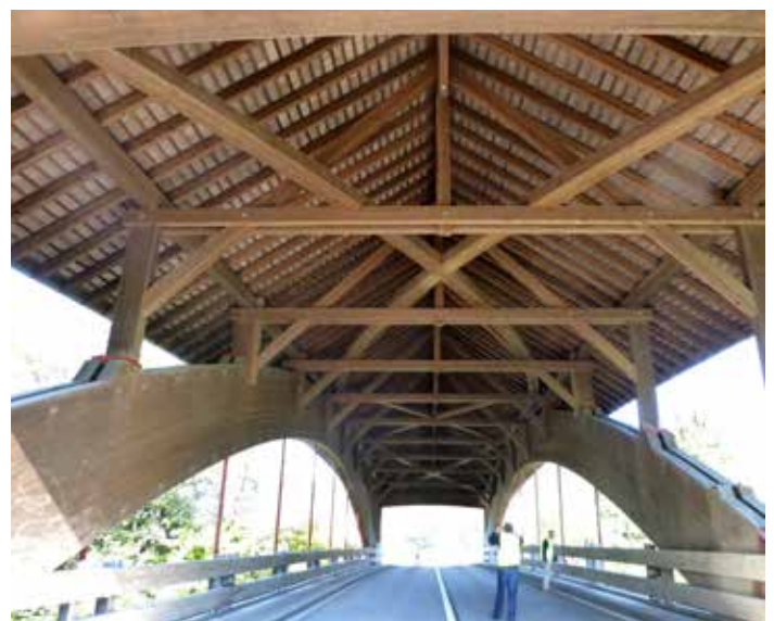
Buebeneibrücke a Signau.