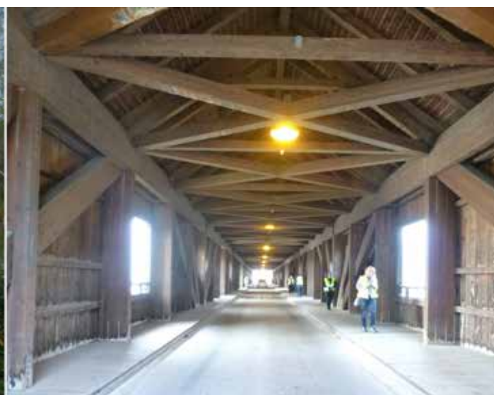
Aarebrücke a Büren an der Aare.