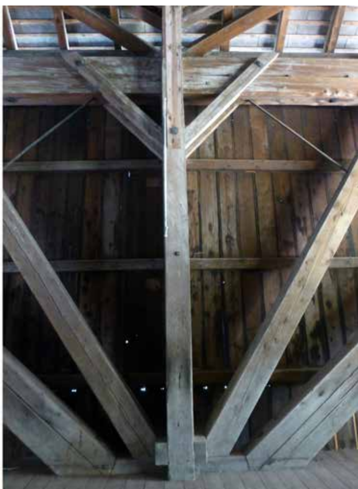
Gohlhausbrücke a Lutzelfluh.