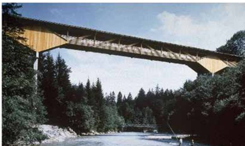
Radwegbrücke nei pressi di Wimmis.