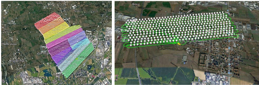
Fig. 1. I voli eseguiti e un esempio di schema di volo eseguito sopra il Comune di Mappano

Object. I punti Ground sono stati usati per generare il DDTM ( Dense Digital Terrain Model , passo 20 cm, 0.7 Gb), e gli altri punti sono stati usati per restituire automaticamente i tetti degli edifici e gli alberi, con una successiva fase di editing manuale per correggere le situazioni complesse.