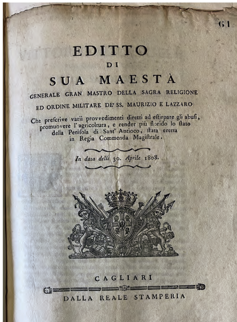
Fig. 5: Editto di Sua Maestà Generale Gran Mastro della Sagra Religione ed Ordine Militare de' SS. Maurizio e Lazzaro Che prescrive vari provvedimenti diretti ad estirpare gli abusi, promuovere l'agricoltura, e render più florido lo Stato della Penisola di Sant'Antioco, stata eretta in Regia Commenda Magistrale, Dalla Reale Stamperia, Cagliari 30 aprile 1808