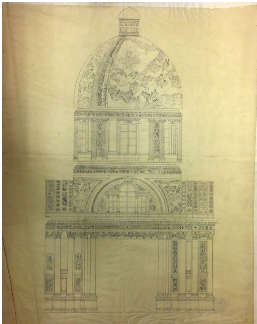
Fig. 4: Carlo Bernardo Mosca, Decorazione interna della Basilica Magistrale di Torino, s.d. [1854 ca]. Disegno a matita su carta da spolvero. Politecnico di Torino, DIST-APRi, Fondo Mosca, doc. n. 296