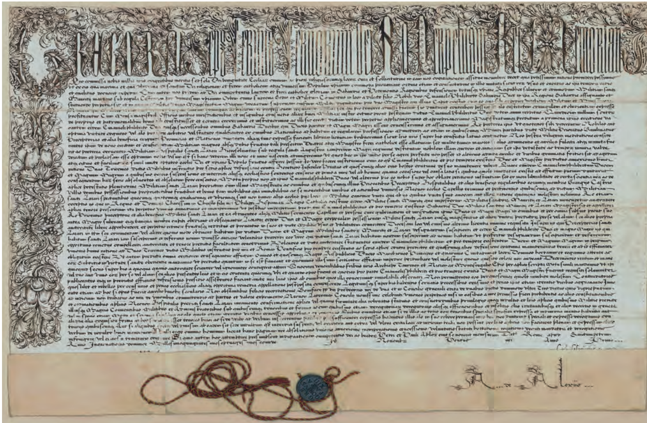
Fig. 1: Bolla di Papa Gregorio XIII colla quale unisce in perpetuo la Milizia Spedaliera di San Lazzaro e gerosolimitano alla Religione di San Maurizio, sotto la regola di Sant'Agostino (regesto sulla camicia), 13 novembre 1572. Inchiostro su pergamena e bulla plumbea con filo serico. Archivio Storico Ordine Mauriziano (AOM), Scritture della Religione de' SS. Maurizio e Lazzaro. Bolle, Privilegi e Brevi pontifici [...] , Supplemento, mazzo unico, fasc. 2. Autorizzazione alla pubblicazione Fondazione Ordine Mauriziano, n. 625, del 08/10/2025, codice 01.2.08