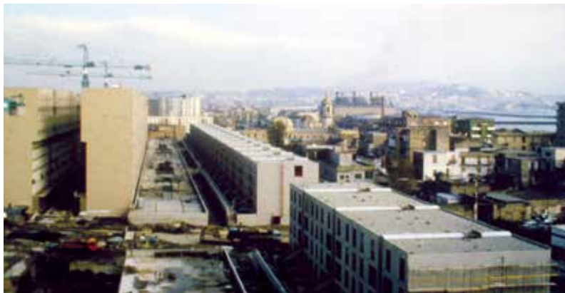
[4] Napoli, il cantiere di edilizia prefabbricata nel comparto di Barra-Pazzigno in una fotografia del 1989.