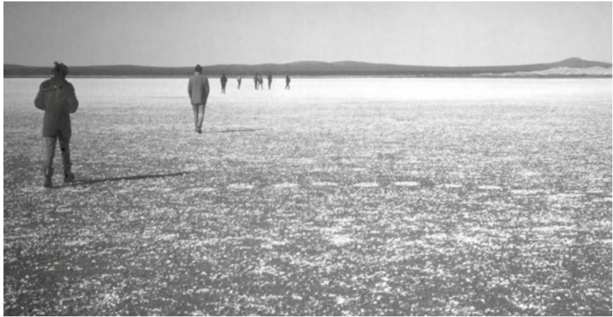
01. Prima Travesía. Viaggio alla scoperta del "mare interno" del continente americano | First Travesía. Journey to discover the "inland sea" of the American continent. 1965.