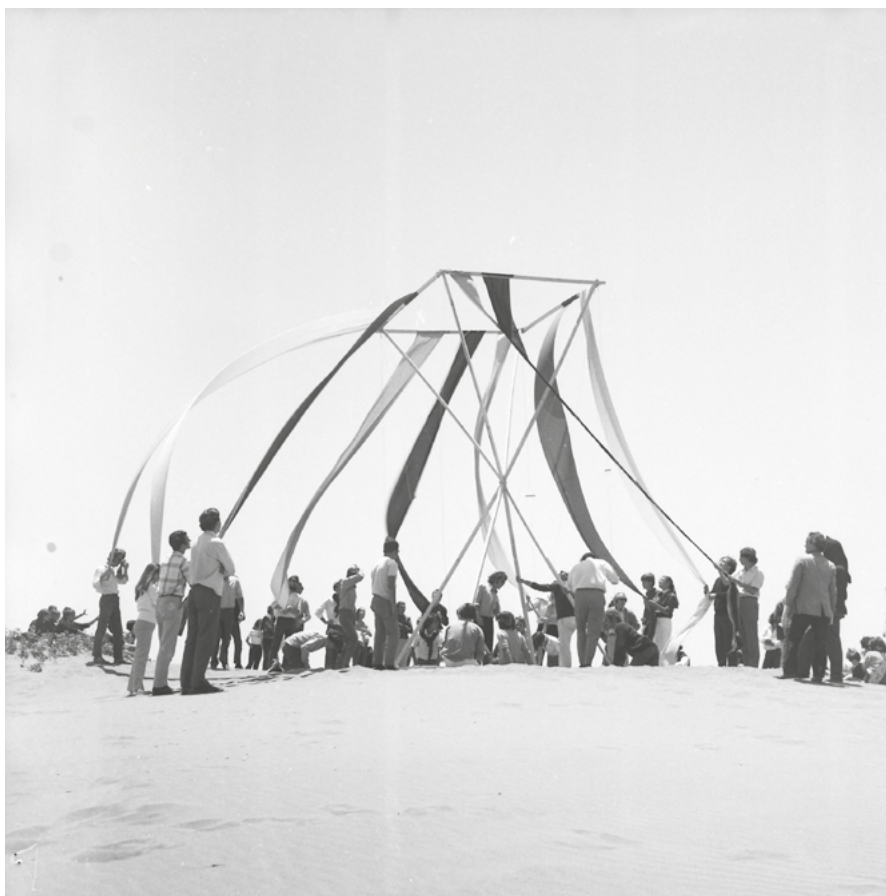
06. Ciudad Abierta, Atto di apertura poetica dei terreni | Ciudad Abierta, Act of poetic opening of the land. 1971.

In tal senso, la persistenza della Ciudad Abierta di Amereida – in quanto espressione materiale dinamica di un manifesto programmatico operativo che si ancora nelle relazioni che gli uomini e le donne stabiliscono con i loro territori – sembra offrire, soprattutto oggi, in mezzo al deserto dei meschini pensieri che travisano i concetti di identità e appartenenza a un luogo, una via altra per l'articolazione e la sintesi della contrapposizione dialettica tra diversi, tra ambienti e culture, tra architettura e vita.*