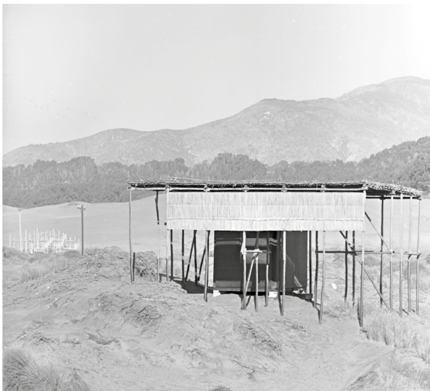
02. Vestale dell'Agorà di Tronquoy | Vestal of the Agora of Tronquoy. 1972.

La phalène è un atto poetico che precede il progetto e viene eseguito per ogni nuova costruzione. Si tratta di eventi che includono esercizi fisici,