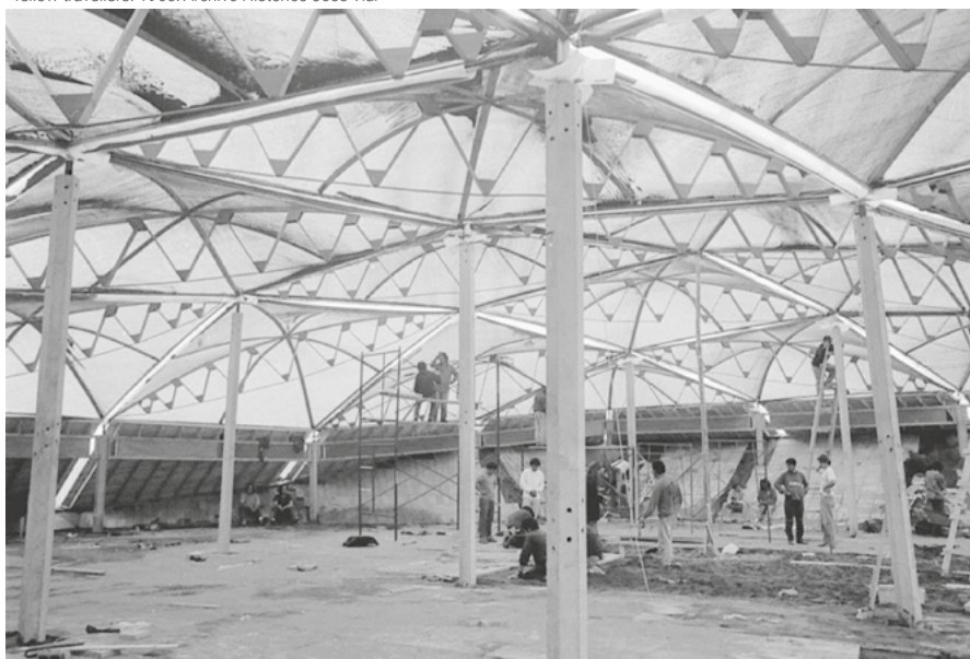
05. "Travesía de los nombres", Casa de los nombres in costruzione | "Travesía de los nombres", Casa de los nombres under construction. 1992.

coreografie spaziali e letture di poesie e sono destinati a definire le relazioni iniziali da instaurare tra il corpo, il sito e lo spazio immaginato, spiritualmente connesso da queste performance.