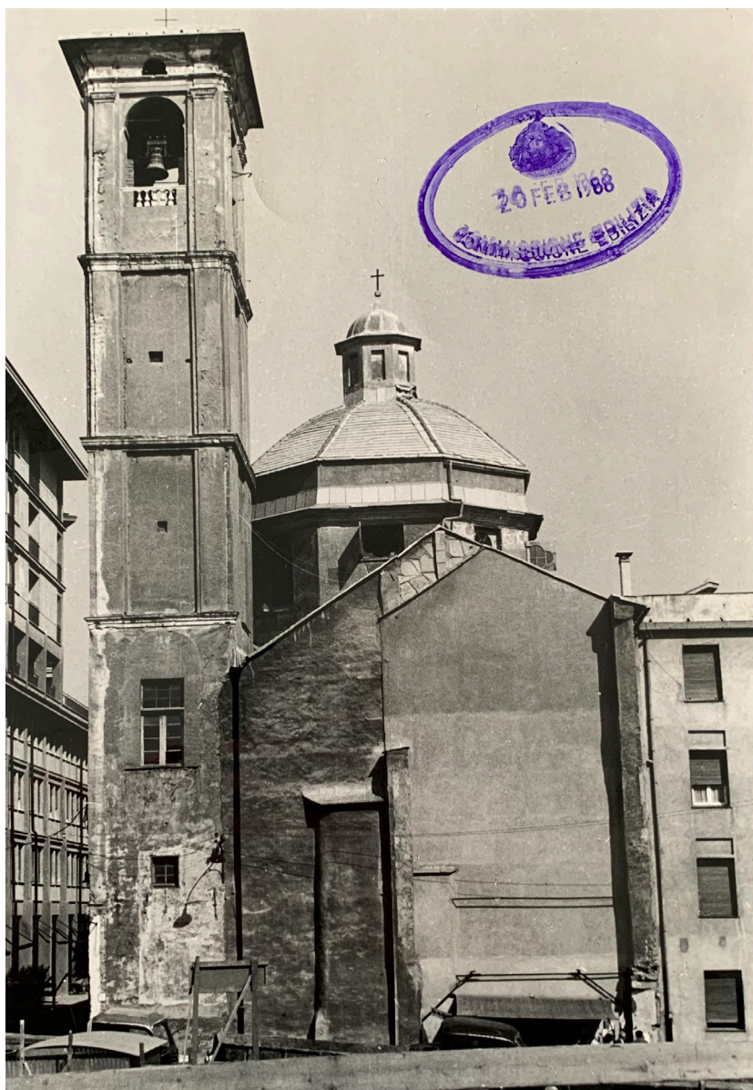
Fig. 3. Sistemazione e restauro Chiesa e Canonica in Piazzetta S. Camillo, stato di fatto, 1964 (AECC, progetto 458/1964).