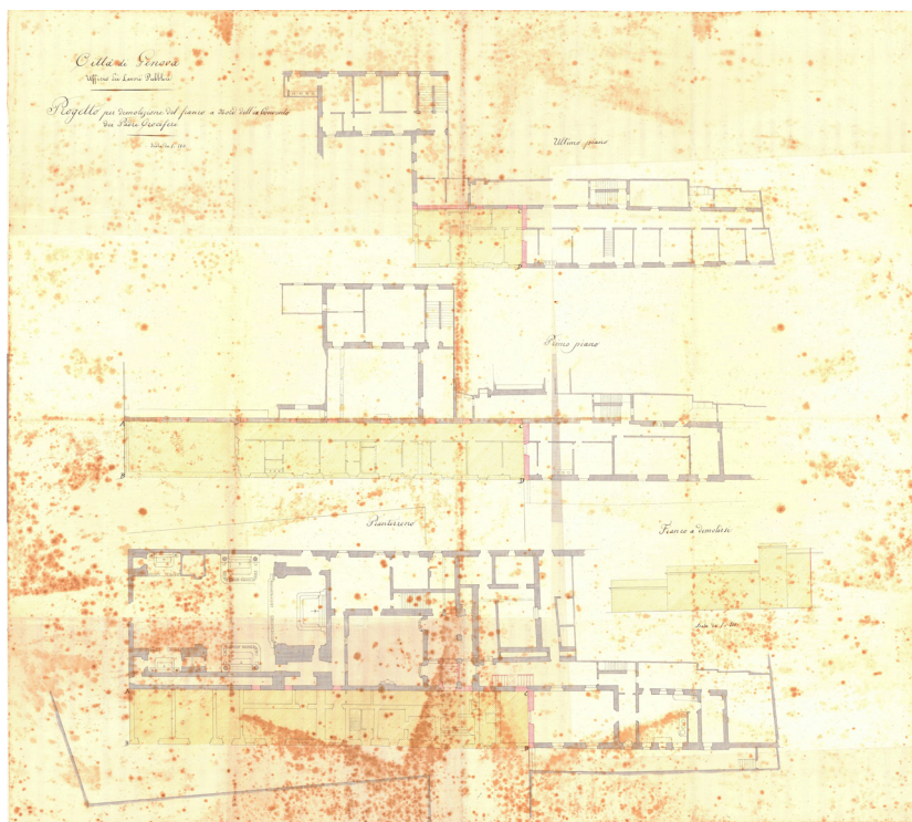
Fig. 2. Progetto per demolizione del fianco a nord dell'ex Convento dei Padri Crociferi [1880] (APP, faldone Santa Croce).

alla chiesa. Il progetto prevede l'allargamento del sedime stradale con la demolizione della manica del complesso addossata al fronte nord della chiesa (Figura 2). Le vicende della seconda metà del XX secolo incidono ulteriormente sulla sede Camilliana: il convento e il tessuto storico limitrofo, incluso l'ospedale di Pammatone, vengono demoliti secondo quanto previsto dal piano particolareggiato di Piccapietra del 1953 15 . Nel caso del complesso, il piano prevede una demolizione completa del convento e la successiva costruzione di una nuova canonica su un'area adiacente. L'esecuzione del progetto comporta la necessità di reintegrare la lacuna architettonica connessa alla messa in luce del lato absidale della chiesa a seguito della demolizione. Nel