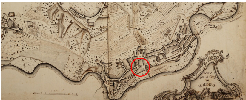
Fig. 5. Piano della città di Mondovì, senza data (AST, Corte, Carte topografiche e disegni, Serie III, Mondovì, mazzo 4).

Francesco Gallo 25 , con ultimazione dei lavori nel 1747 26 . Tra il 1760 e 1761 “si principiò e si terminò l’opera veramente bella e grandiosa della facciata, che era pria guasta, e quasi tutta rotta e rovinosa”, con l’inserimento di una porta nel 1763 27 .