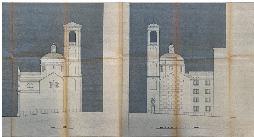
Fig. 4. Sistemazione e restauro Chiesa e Canonica in Piazzetta S. Camillo, progetto per fronti nord e ovest, 1964 (AECG, progetto 458/1964).

esibendo, ed altre attigue case, per quindi propria casa e chiesa formarne” 21 ;