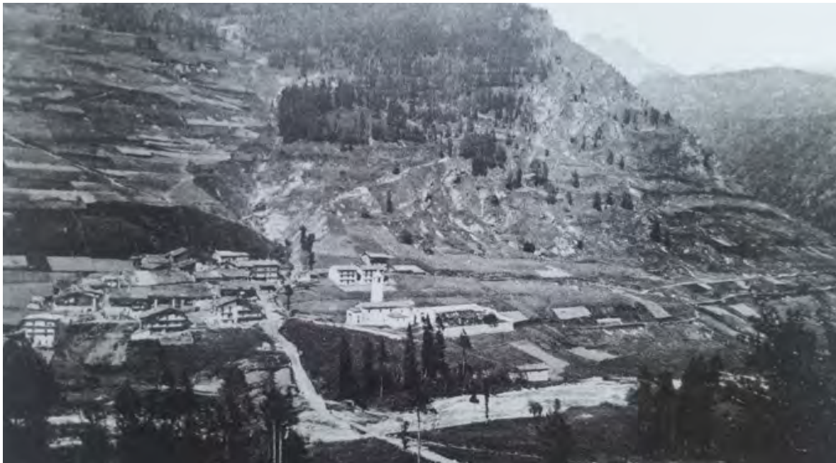
Figura 1. Pontechianale, Borgata Chiesa (Cuneo). Panorama complessivo della valle, cartolina (da INFOSI 2010, p. 49).