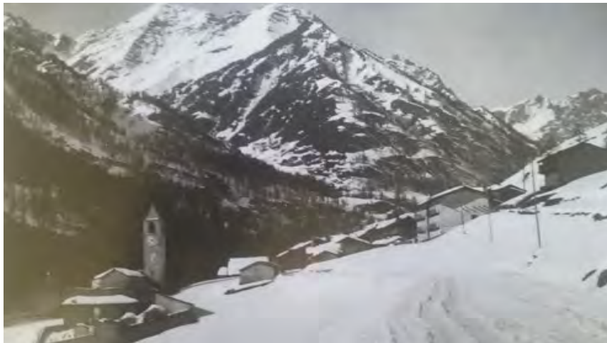
Figure 6-7. Pontechianale, Borgata Chiesa. Raffronto tra la borgata sommersa (da INFOSSI 2010, p. 81) e la ricostruzione, presso la borgata Maddalena, della nuova chiesa e delle nuove abitazioni (foto I. Ruiz Bazán, 2019).