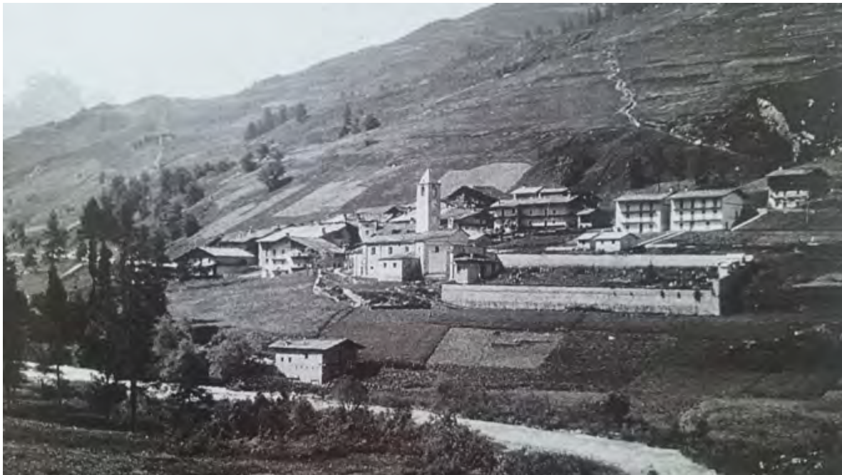
Figura 4. Pontechianale, Borgata Chiesa. Vista con il torrente Varaita, il mulino e il recinto del cimitero (da INFOSSI 2010, p. 77).

che erano temporaneamente emigrati per lo più in Francia in cerca di lavoro, non ci sarà altro che un risarcimento in denaro, chiaramente troppo esiguo per consentire l'acquisto di una nuova casa. Nonostante la resistenza di alcuni abitanti che sino a allagamento iniziato non abbandonarono le proprie case 25 e vennero costretti a farlo dall'intervento dei Carabinieri, a metà del 1942 il bacino era completamente riempito (fig. 5). A seguito della sommersione della borgata, quindi, oltre alle case venne realizzata anche la nuova chiesa, che conservò la titolazione a San Pietro.