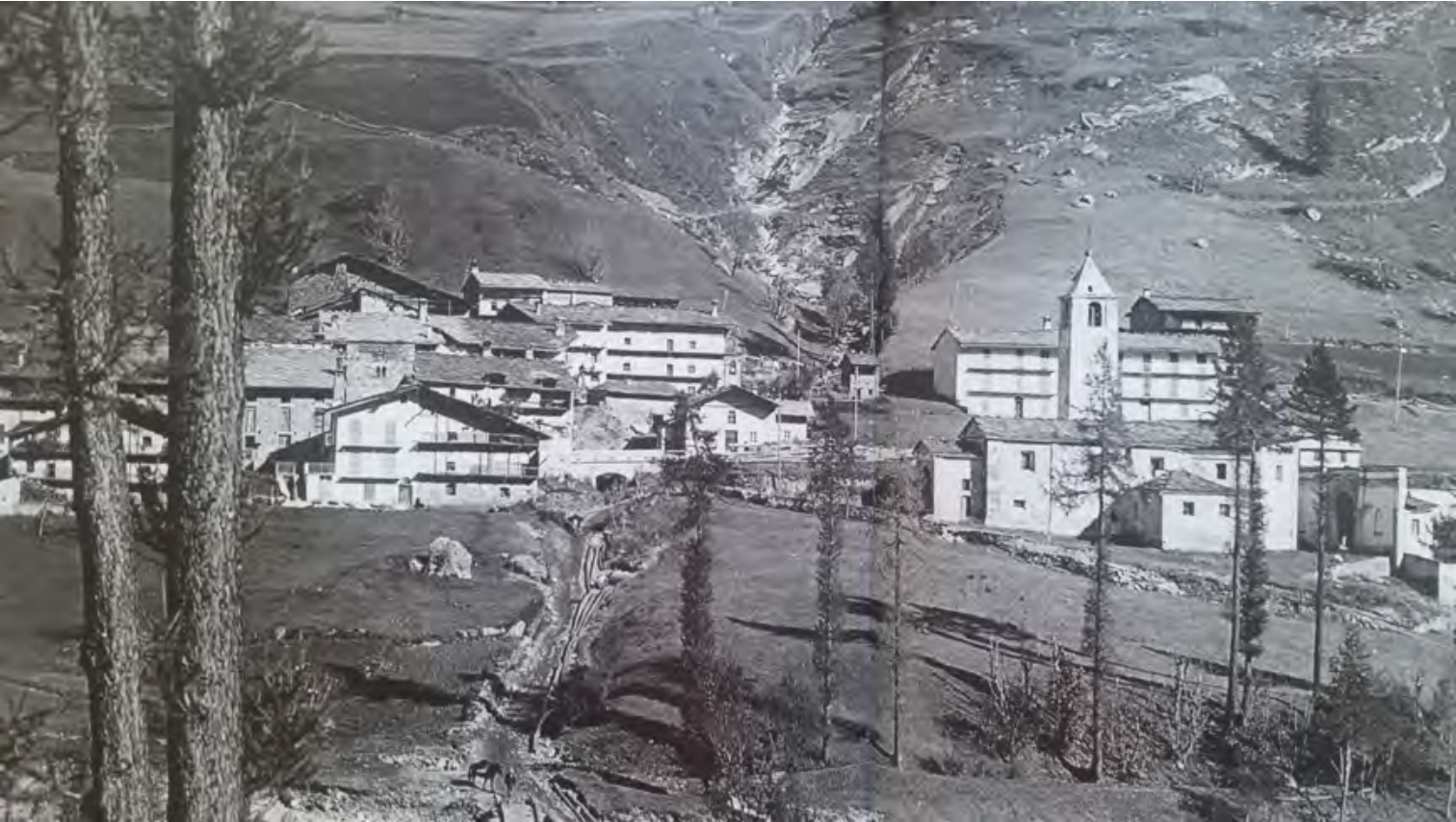
Figura 3. Pontechianale, Borgata Chiesa. Panorama, cartolina (da INFOSSI 2010, p. 57).