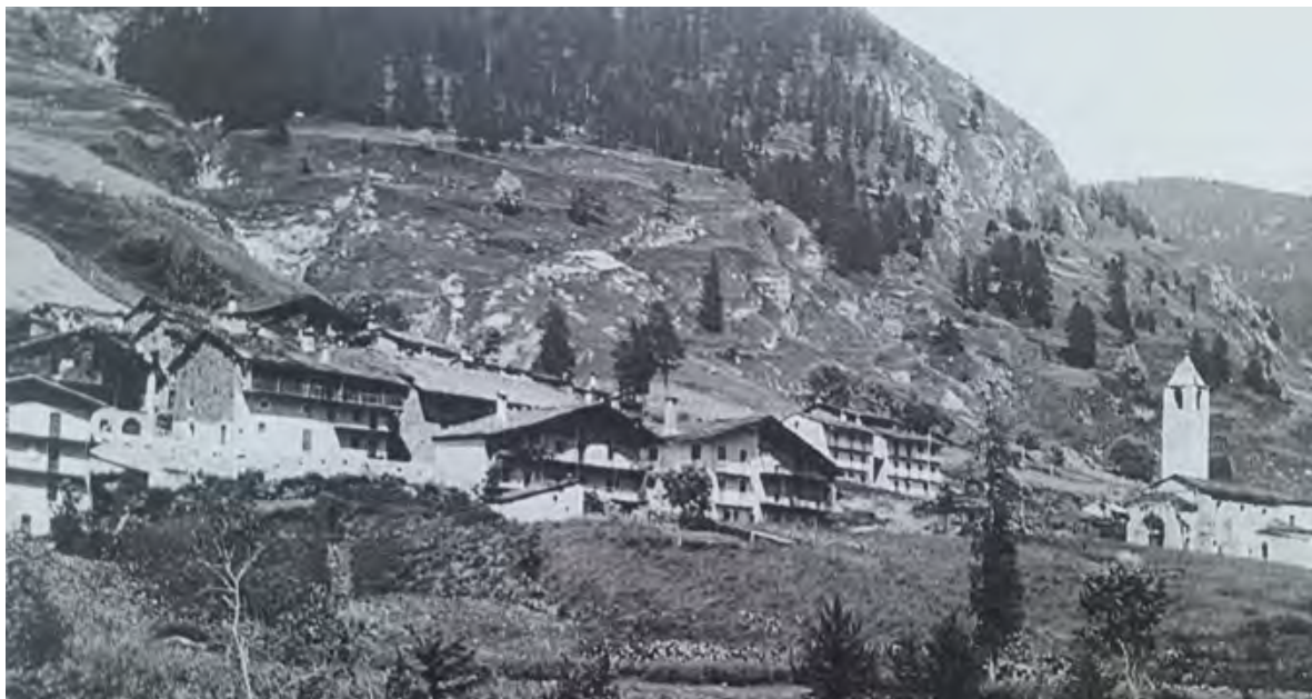
Figura 2. Pontechianale, Borgata Chiesa. Vista della borgata con la chiesa di San Pietro in Vincoli, cartolina (da INFOSSI 2010, p. 55).

distinte, separate da una vallicola che scende verso il torrente principale, superata da un piccolo ponte a una arcata: verso est, la chiesa di S. Pietro in Vincoli di origine medievale con interessante portale strombato in marmo e pietra verde dal quale risultano assenti le tre colonnine per lato che un tempo lo arricchirono, il cimitero, la cappella invernale realizzata nel 1933 all'imbocco del ponte e dedicata a Santa Caterina e due grandi abitazioni plurifamiliari gemelle di tre piani fuori terra, «note come le case 'Gallian' [...] che destavano ammirazione [...] perché già dotate di autorimesse» 22 ; verso ovest un gruppo più denso di case, il vero e proprio borgo, situate in modo da seguire le curve di livello e fortemente caratterizzate dai tetti in pietra e dall'orizzontalità dei balconi continui in legno in facciata (fig. 2).