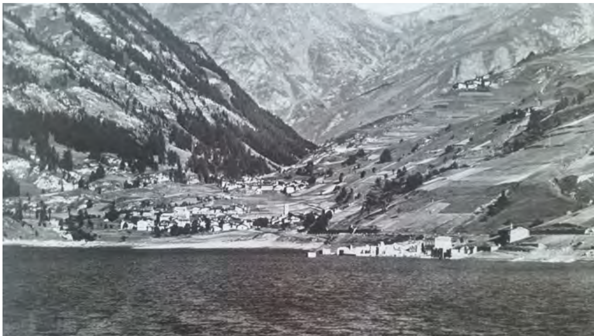
Figura 5. Pontechianale, Borgata Chiesa. La sommersione della borgata (da INFOSSI 2010, p. 85).

La ri-fondazione, in questo caso specifico, cerca di rispondere a quella relazione di sradicamento e di alterità che abbiamo detto si innesca a causa dell'abbandono: c'è infatti un tentativo di riconnettere il passato con il presente attraverso la traslazione dell'antico portale della chiesa che diviene il nuovo punto d'ingresso di una configurazione che meglio risponde alle esigenze dei fedeli, essendo più ampia e comprendendo, ad esempio, la cappella invernale come parte integrante del complesso chiesastico.