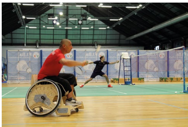
Figura 2. Fase di testing in collaborazione con la squadra italiana di para-badminton.

Un prototipo può avere finalità, materiali e aspetto differenti: dal modello di carta al modello realistico prossimo al risultato definitivo. La necessità di strumenti e macchinari diversi ha reso il Fablab Torino uno spazio chiave non solo per l'interazione con le persone della community, ma anche per la disponibilità di macchinari CNC (Computer Numerical Control) per la prototipazione rapida utilizzabili grazie alla condivisione delle competenze tra le persone. Questo avviene sia a livello locale che a livello globale grazie alla condivisione di tutorial, progetti, sperimentazioni e know-how che la comunità mondiale dei Makers rende disponibili in Open Source permettendo la formazione a distanza di altre persone, oltre ovviamente alla possibilità di sviluppo dei progetti con implementazioni libere e condivise. Questo iter ciclico di prototipazione, condivisione, confronto multidisciplinare, test, riprogettazione e prototipazione, viene accelerato dalla facilità nella realizzazione dei modelli, della condivisione delle informazioni via web, e dal coinvolgimento nel progetto di una platea sempre più ampia: dal locale al globale. Nel caso specifico di Toowheels, nella fase iniziale di