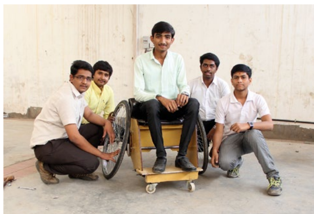
Figura 3. Il team di sviluppo della Gujarat Technological University.