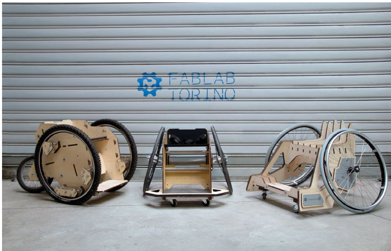
Figura 4. Tre versioni alternative della sedia sviluppate per usi e in collaborazioni diverse.

sviluppo i soggetti coinvolti erano principalmente sul territorio torinese, per poi allargarsi a collaborazioni su una rete più ampia coinvolgendo l'unità spinale dell'Ospedale Niguarda di Milano e la squadra Bresciana di basket in carrozzina Icaro Sport.