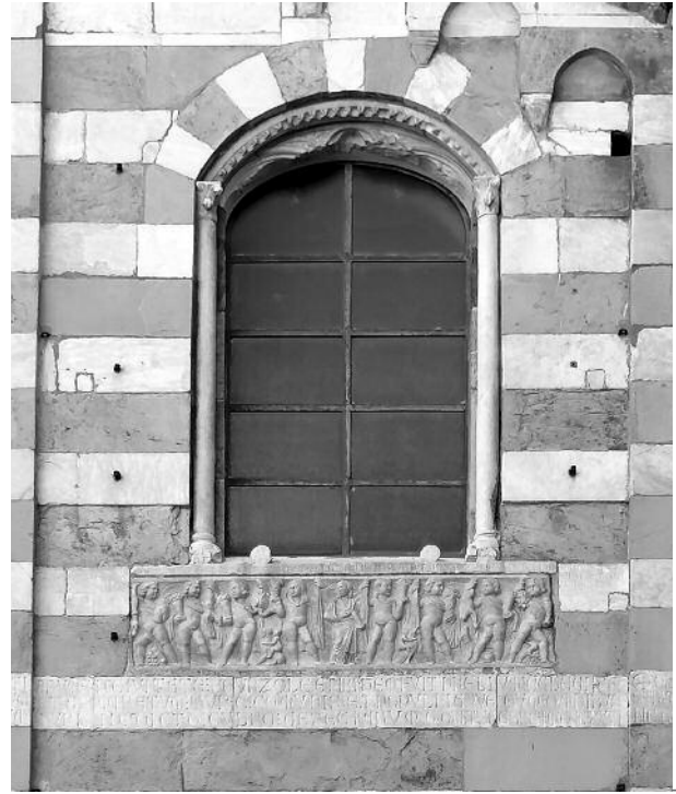
8_Genova, San Matteo, particolare della facciata, con il sarcofago di Lamba Doria e le iscrizioni celebrative.