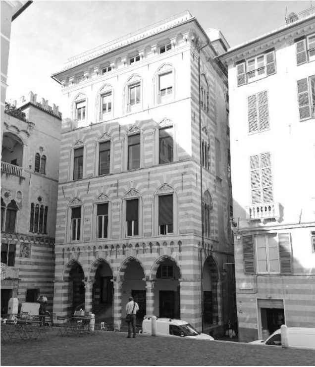
7_Genova, piazza San Matteo, Palazzo Lamba Doria.