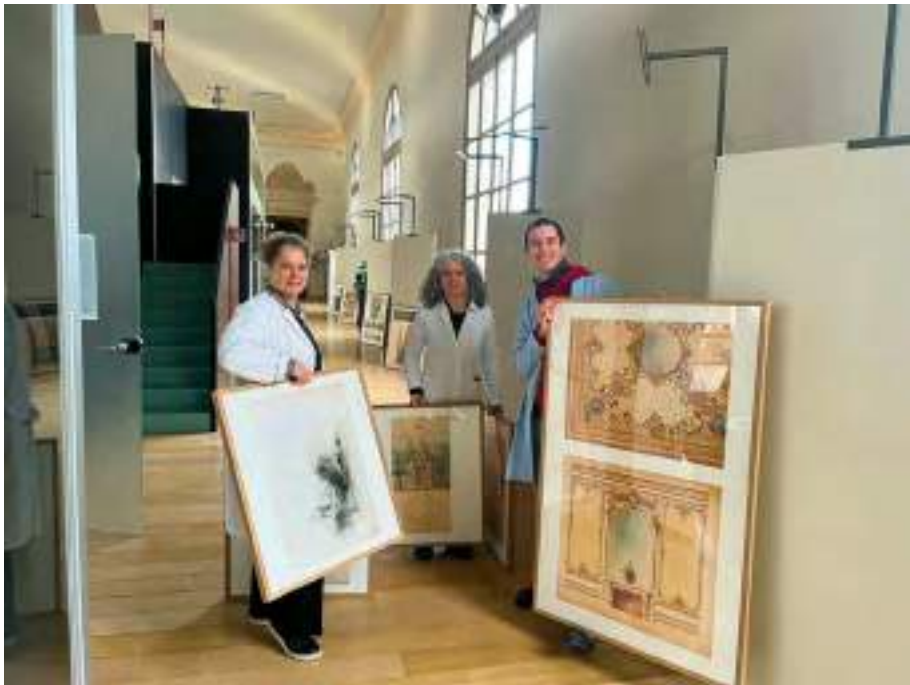
I curatori della mostra dedicata a Carlo Musso e allestita nella manica lunga del DIST in fase di montaggio, dicembre 2024.

Non meno oggetto di soddisfazione la parallela costruzione di una vera e propria “rete” di relazioni, che ha messo il gruppo di ricerca in contatto con altri archivi (a cominciare ovviamente dal rinsaldare i rapporti con i principali luoghi di conservazione torinesi, l'Archivio di Stato e l'Archivio Storico della Città di Torino), enti di conservazione e prestigiose istituzioni (la Direzione della Villa Reale di Monza e le Collezioni del Quirinale sono state contattate nell'infruttuoso tentativo di comprendere quale sorte fosse toccata ai monumentali centri tavola dei quali il