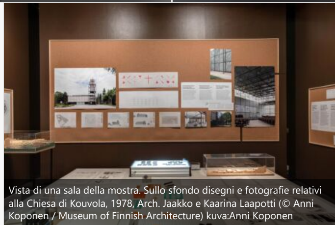
Vista di una sala della mostra. Sullo sfondo disegni e fotografie relativi alla Chiesa di Kouvola, 1978, Arch. Jaakko e Kaarina Laapotti