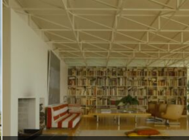
Casa-studio di Antti e Vuokko Nurmesniemi, Helsinki, 1976, Arch. Antti Nurmesniemi