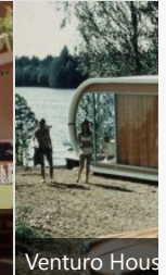
Venturo House della serie Casa CF-45, 1971, (© Museum of Finnish Architecture)