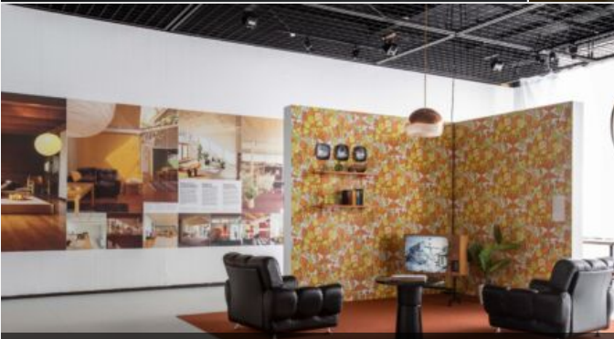
Vista di una sala della mostra "Concrete Dreams. And Other Perspectives on 1970's Architecture"