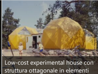
Low-cost experimental house con struttura ottagonale in elementi plastici, 1972, Arch. Raimo Kallio-Mannila, (© Lars Hallén / Museum of Finnish Architecture)

anni '70 (© Teuvo Kanerva / KAMU Espoo City Museum)