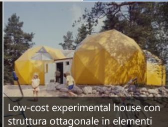
Low-cost experimental house con struttura ottagonale in elementi plastici, 1972, Arch. Raimo Kallio-Mannila, (© Lars Hallén / Museum of Finnish Architecture)

anni '70 (© Teuvo Kanerva / KAMU Espoo City Museum)