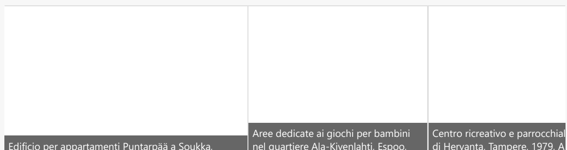
Immagine di copertina: © Volker von Bonin, 1976 / Helsinki City Museum

La serie di eventi invita a riflettere sul valore e sul ruolo che queste architetture assumono ora che hanno raggiunto un'età in cui necessitano d'interventi indirizzati al loro recupero . Un'azione di sensibilizzazione e partecipazione che sarebbe necessaria anche in Italia, dove la tutela dell'architettura del secondo Novecento è ostacolata da una normativa nazionale che limita il vincolo agli edifici con più di settant'anni e dove assistiamo quotidianamente a ingiustificate demolizioni e riqualificazioni energetiche che alterano irrimediabilmente i caratteri percettivi e i materiali originari non solo delle architetture degli anni settanta, ma anche di quelle degli anni sessanta e cinquanta.