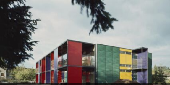
Casa bifamiliare Enarvi a Tammissalo, Helsinki, 1973, Arch. Juhani Pallasmaa. L'artista Tor Arne collabora per la scelta dei colori dei pannelli plastici di rivestimento delle facciate