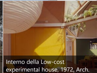
Interno della Low-cost experimental house, 1972, Arch. Raimo Kallio-Mannila

Pietilä