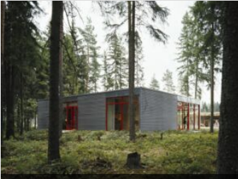
Aluminium House, Paimio, 1972, Arch. Ilkka Salo

Espoo, 1974, Arch. Aulis Blomstedt