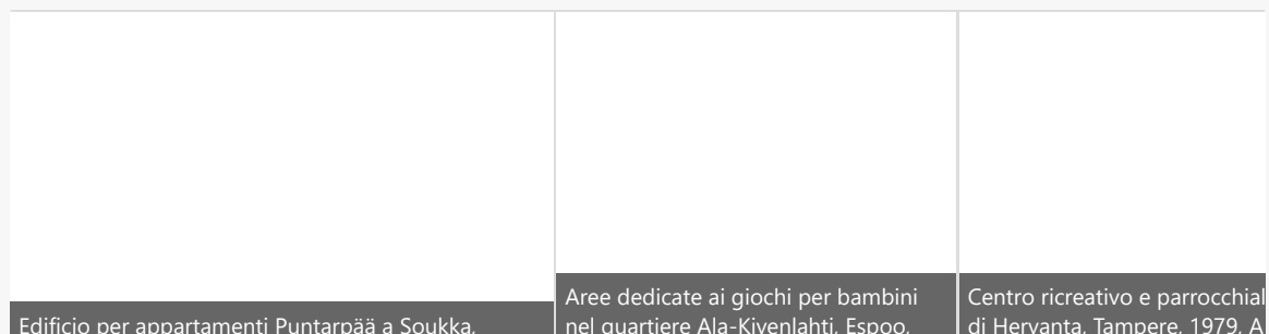
Immagine di copertina: © Volker von Bonin, 1976 / Helsinki City Museum

La serie di eventi invita a riflettere sul valore e sul ruolo che queste architetture assumono ora che hanno raggiunto un'età in cui necessitano d'interventi indirizzati al loro recupero . Un'azione di sensibilizzazione e partecipazione che sarebbe necessaria anche in Italia, dove la tutela dell'architettura del secondo Novecento è ostacolata da una normativa nazionale che limita il vincolo agli edifici con più di settant'anni e dove assistiamo quotidianamente a ingiustificate demolizioni e riqualificazioni energetiche che alterano irrimediabilmente i caratteri percettivi e i materiali originari non solo delle architetture degli anni settanta, ma anche di quelle degli anni sessanta e cinquanta.