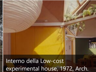
Interno della Low-cost experimental house, 1972, Arch. Raimo Kallio-Mannila

Pietilä