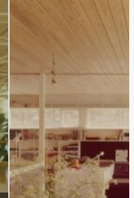
Casa di Eero Aarnio, Helsinki, 1977