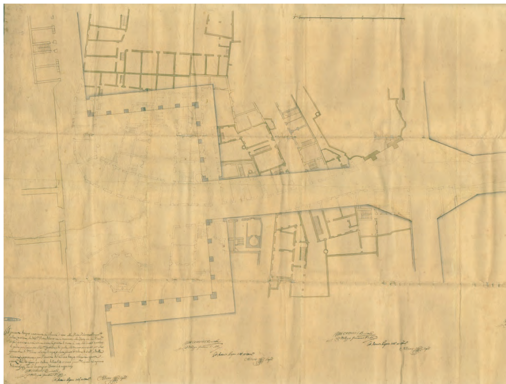
Fig. 3 - Filippo Juvarra. Progetto per la rettifica di Contrada di Porta Palazzo, 3 maggio 1729. Particolare della piazza aperta verso Porta Palazzo (Archivio Storico della Città di Torino, Carte sciolte, n. 1550).

presente in Comune, figura ancora incaricata di seguire le vicende che interessano la sistemazione della Città vecchia, ma anche chiamata ad assolvere ai suoi tanti incarichi tra cui quello di esaminatore di Carlo Francesco Pagano estimatore [12] .