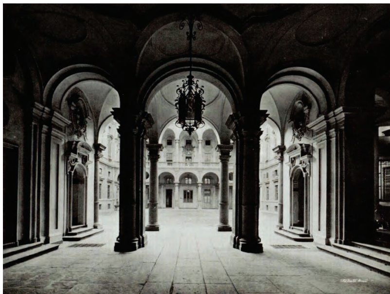
Fig. 2 - Torino, Palazzo Saluzzo Paesana: atrio.

Il dibattito municipale sulla trasformazione degli isolati nell'area di Porta Palazzo si protrae negli anni a causa di complesse vicende che interessano le proprietà e le necessarie pratiche di esproprio. È nella trattazione del progetto generale che si riconoscono i due ruoli dello Stato e della Municipalità, impersonati da Filippo Juvarra, che impartisce gli ordini del sovrano e da Gian Giacomo Plantery, che si occupa dei provvedimenti esecutivi emessi dal Comune.