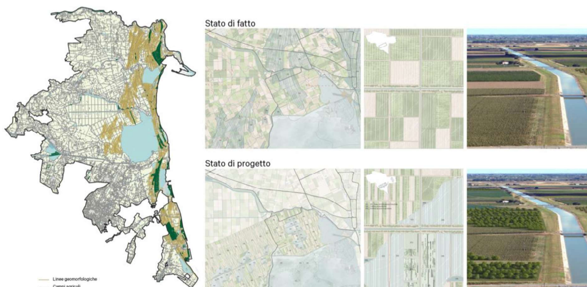
Figura 3 | Possibile localizzazione delle area di implementazione AFI, secondo la struttura geomorfologica del territorio.

Sulla destra, un esempio di trasformazione del paesaggio agricolo a fronte dell'inserimento di nuove AFI.