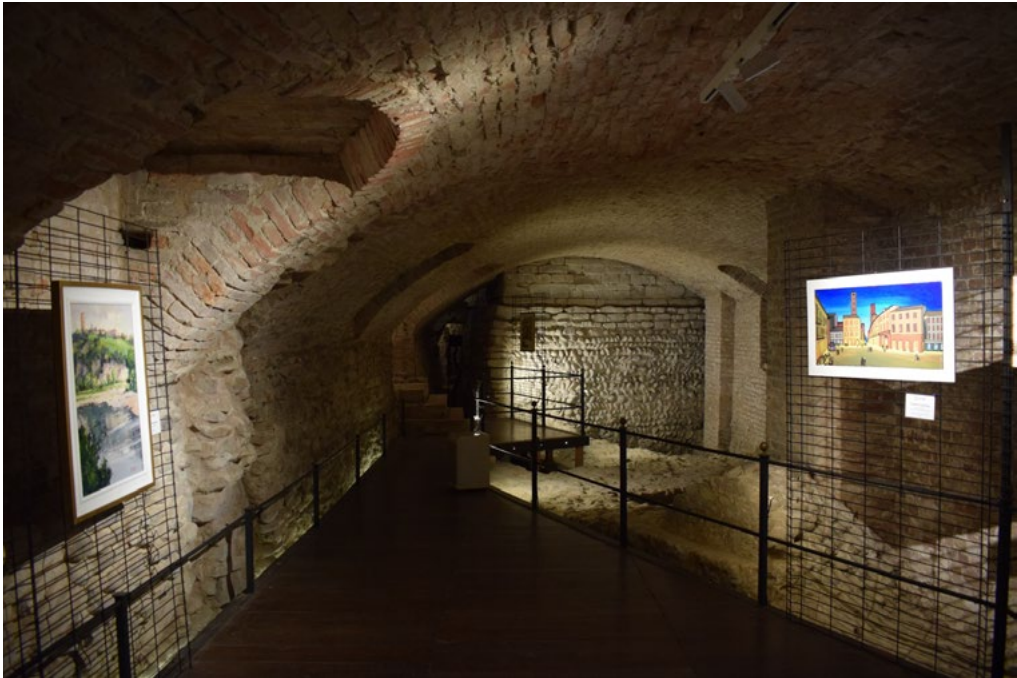
3: Interno del percorso archeologico. Si noti la struttura voltata realizzata nel XIV secolo come scantinato delle abitazioni, poi trasformato in deposito della chiesa sino all'intervento di restauro. Ai lati, alcune opere della pinacoteca, 2022.

deve saper trovare la migliore soluzione, nel pieno rispetto dell'opera. A tal proposito risulta fondamentale considerare che gli interventi di questa natura debbono avere quale primo obiettivo la conservazione del bene, perciò i processi di valorizzazione che vengono attuati devono, in ogni caso, adeguarsi ai principi di tutela [Romeo 2021].