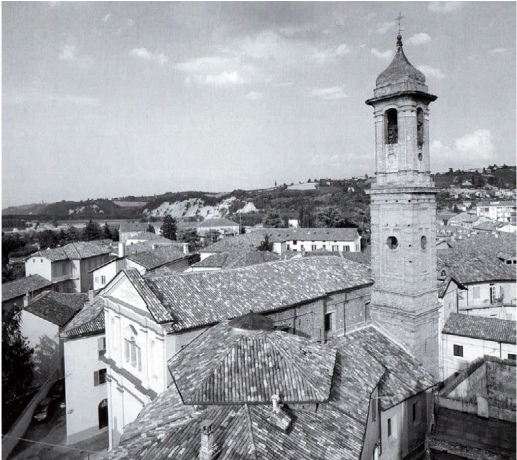
1: Enrico Necade, Il complesso della chiesa di San Giuseppe e del suo campanile con sullo sfondo la prima collina, in primo piano la copertura della cappella del Crocifisso, 2002 [La chiesa di San Giuseppe. Restauri e studi per una sede di culto in Alba, a cura di W. Accigliaro, M. Rabino, Alba, Edizioni Albesi, p. 114].

A partire dal 1996, l'intervento di restauro della chiesa, ha permesso di studiare in maniera approfondita le tracce conservate in situ , realizzando un percorso di visita che permette di accedere al livello interrato, divenuto nel tempo cantina dell'edificio residenziale durante l'epoca medievale e poi locale di sgombero della chiesa, sino alla sua