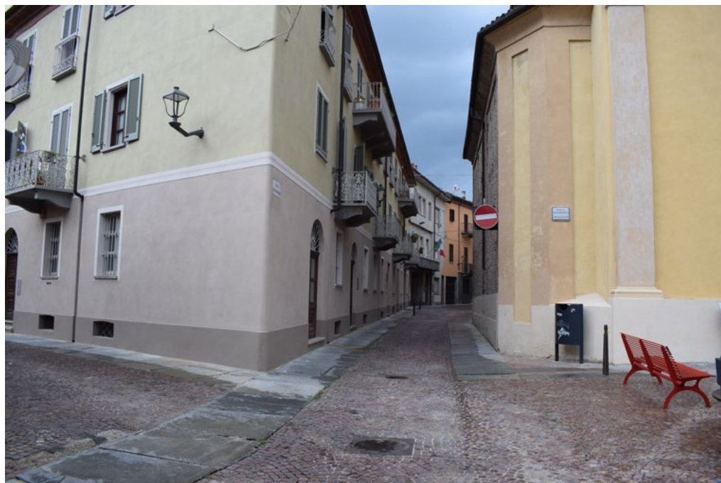
4: Visuale su via Mazzini. Sulla destra la chiesa di San Giuseppe, a sinistra casa Coppa all'angolo con via senatore Como, 2022.

sito, al centro studi Beppe Fenoglio, al museo civico Federico Eusebio, alla chiesa di San Domenico e al museo diocesano situato nella cripta della cattedrale.